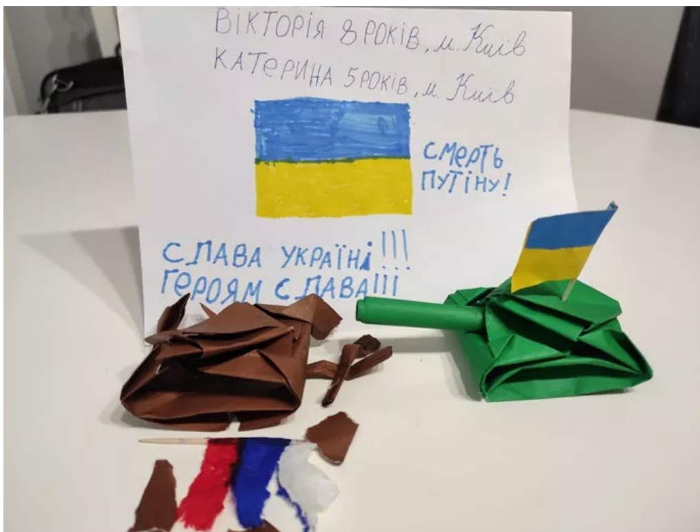
Mise en scène de guerre « Mort à Poutine ! Gloire à l'Ukraine ! Gloire aux héros ! »

De nombreux quotidiens de presse et magazines en ligne ont choisi de mettre en lumière les regards des enfants au travers de leurs dessins afin d'illustrer les réalités de la guerre en Ukraine. Le Washington Post est ainsi allé à la rencontre de jeunes réfugiés de la gare de Przemysl, en Pologne, près de la frontière ukrainienne afin de comprendre comment ils vivaient la guerre au quotidien, en leur demandant de dessiner ce qui les avait marqués au cours des dernières semaines. Trois moments clés ont émergé : le départ de la maison et le fait de quitter sa famille ; le voyage en train et les séparations à la frontière ; et les dessins représentant des éléments liés au combat (comme des chars et des militaires). Plusieurs autres articles de presse tels que celui du quotidien ukrainien Ukrayinska Pravda (illustration ci-après) ont également donné à voir des dessins d'enfants réalisés lors d'activités artistiques ciblant les enfants déplacés et réfugiés. Les enfants dessinent la guerre avec d'un côté, le soutien aux forces ukrainiennes, et de l'autre, l'horreur de la guerre.