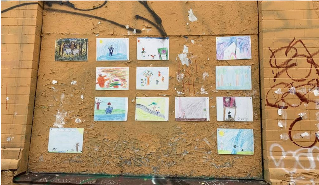
Dessins d'enfants accrochés sur un mur dans une rue de Kiev

Les arts communautaires constituent une autre pratique artistique visant à engager les membres de la communauté dans un processus de création artistique dans leur propre environnement. L'initiative est généralement guidée par des artistes professionnels qui collaborent avec les membres de la communauté pour les aider à exprimer à leur manière leurs idées, leurs histoires et leurs perspectives. La participation active des membres de la communauté dans le processus de cocréation est aussi essentielle que le résultat final. Dans un contexte de guerre, cela peut constituer une méthode efficace pour sensibiliser les enfants et leurs familles aux messages vitaux et aux services essentiels disponibles dans leur environnement immédiat.