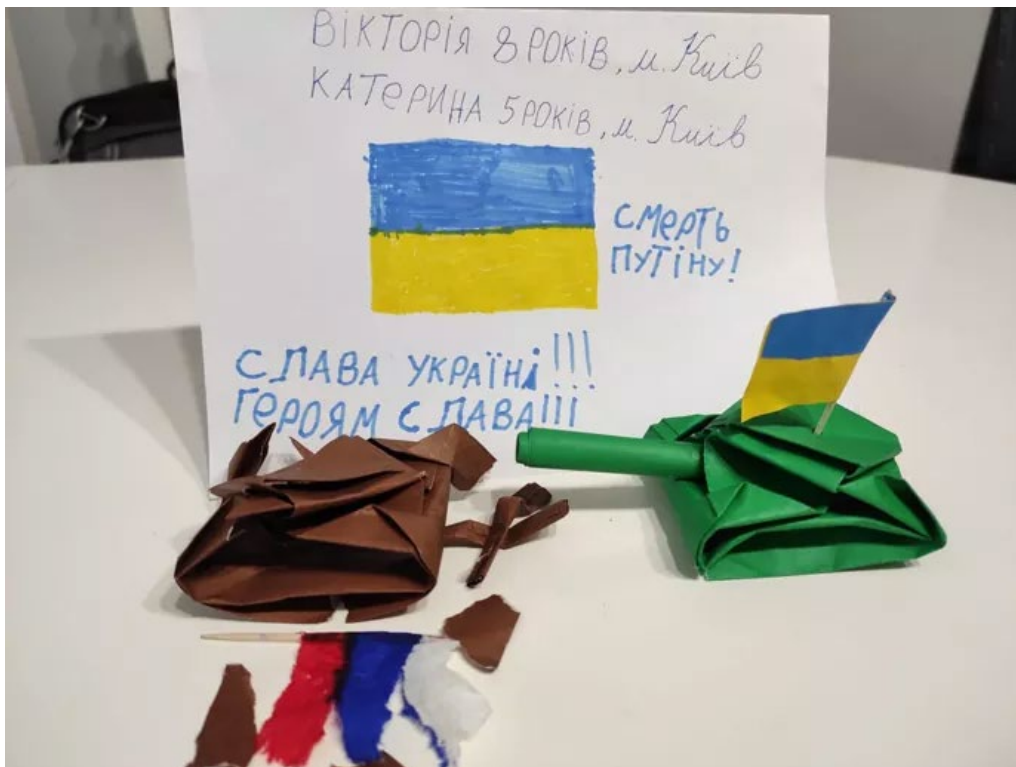
Mise en scène de guerre « Mort à Poutine ! Gloire à l'Ukraine ! Gloire aux héros ! »

De nombreux quotidiens de presse et magazines en ligne ont choisi de mettre en lumière les regards des enfants au travers de leurs dessins afin d'illustrer les réalités de la guerre en Ukraine. Le Washington Post est ainsi allé à la rencontre de jeunes réfugiés de la gare de Przemysl, en Pologne, près de la frontière ukrainienne afin de comprendre comment ils vivaient la guerre au quotidien, en leur demandant de dessiner ce qui les avait marqués au cours des dernières semaines. Trois moments clés ont émergé : le départ de la maison et le fait de quitter sa famille ; le voyage en train et les séparations à la frontière ; et les dessins représentant des éléments liés au combat (comme des chars et des militaires). Plusieurs autres articles de presse tels que celui du quotidien ukrainien Ukrayinska Pravda (illustration ci-après) ont également donné à voir des dessins d'enfants réalisés lors d'activités artistiques ciblant les enfants déplacés et réfugiés. Les enfants dessinent la guerre avec d'un côté, le soutien aux forces ukrainiennes, et de l'autre, l'horreur de la guerre.