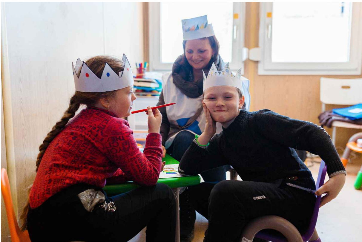
Enfants jouant dans le Child friendly space Blue Dot au poste-frontière en Moldavie.

L'UNICEF et des ONG partenaires ont en outre développé des « espaces de sécurité » appelés Blue Dots aux postes-frontière avec l'Ukraine et en Roumanie, en suivant le flux d'enfants affectés par la situation en Ukraine. Ces lieux permettent aux enfants et à leurs familles (souvent des femmes seules) de se reposer et de se défaire du stress et de la fatigue de leur laborieux périple. Ils fournissent des informations essentielles aux familles qui voyagent, aident à identifier les enfants non accompagnés et séparés afin d'assurer leur protection. Les enfants peuvent notamment réaliser des activités artistiques en se socialisant. L'accès à l'imaginaire, le fait de retrouver un sentiment de normalité lors d'activités de groupe et la création développent un sentiment d'accomplissement. L'objectif du projet Blue Dots est de relier ces points bleus pour s'assurer que tous les enfants sont suivis, localisés, protégés et arrivent sains et saufs à destination.