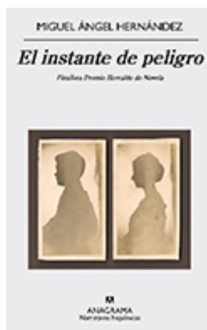
Fig. 2 Cubierta de El instante de peligro .

después de ver el vídeo. La cubierta condensa la complejidad de la novela con su doble temporalidad, con los dos Marcos, sujeto y objeto, yo narrante y yo narrado.