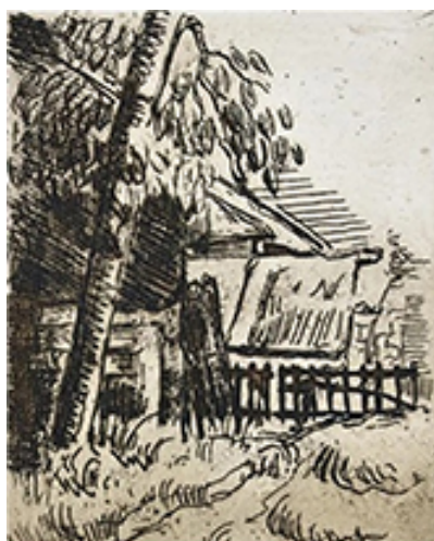
Fig. 4 «Paysage à Auvers», 1873.

© Paul Cézanne, Sterling and Francine Clark Institute, Willamstown, Massachusetts, USA / Bridgeman Images.