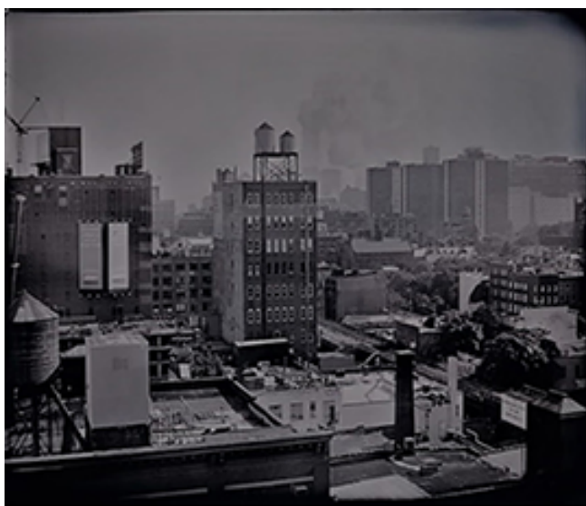
Fig. 5 «September 11», 2011

pensé que lo que me sucedía a mí con Anna en esos momentos era algo semejante: había comenzado a ver mi presente con los ojos de Lara, o con lo que yo creía que podrían haber sido los ojos de Lara, los ojos que intentaban adecuarse a una realidad que probablemente la superaba. Yo estaba ahora en el otro lado. Y el pasado de los otros se convertía en mi presente. O al revés. [...] De nuevo, pura heterocronía. (Hernández 2015: 160).