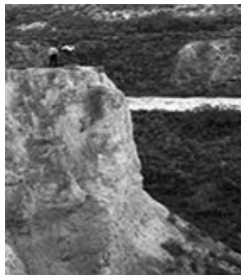
Fig. 8 «Barranco». Fotografía aparecida en el periódico La Verdad , 26/12/1995.