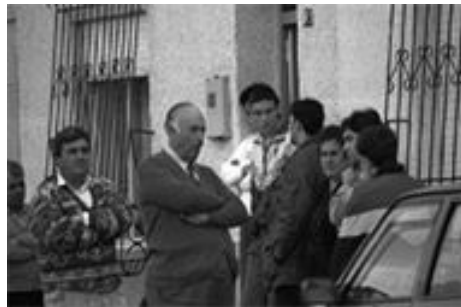
Fig. 6 «Grupo de personas». Fotografía aparecida en el periódico La Verdad , 26/12/1995.