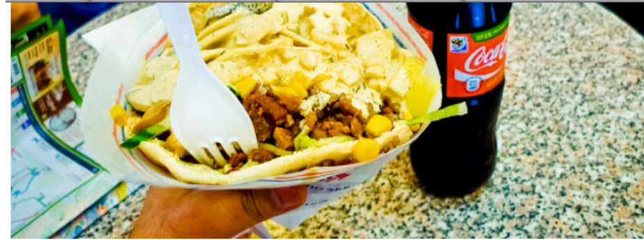
Matretten kebab har ikke noe med språk å gjøre

https://www.nrk.no/ytring/kebabnorsk-og-retten-til-det-norske-1.11401618