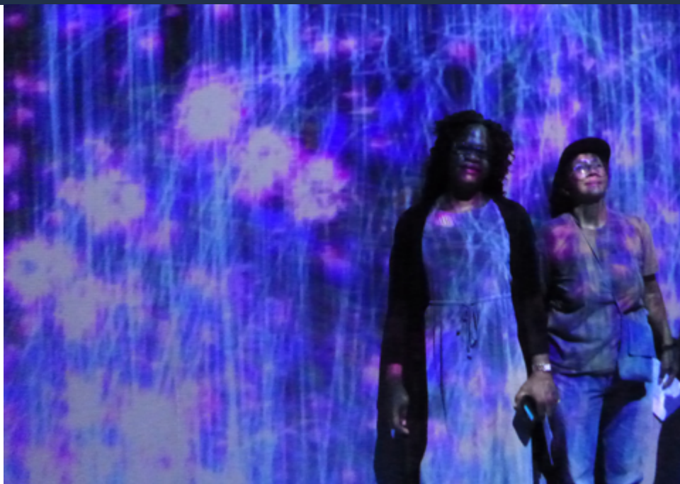
Visite de l'exposition « TeamLab : au-delà des limites » à La Villette

L'instrumentalisation de la culture/sport/loisirs, et sa déconnexion des autres problématiques sociales pourraient être contre-productives. En effet, cela relègue ces dimensions à