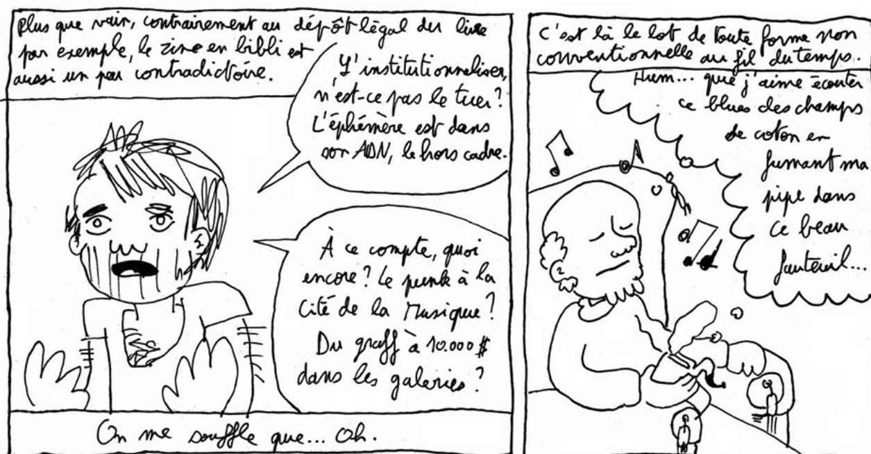
IMAGE 1 : Extrait de « Fanzines et mémoire » dans Définir le fanzine , L'Égouttoir, 2022