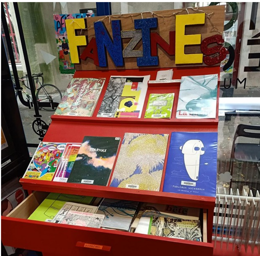
IMAGE 3 : Le meuble à fanzines de La Manufacture de Nantes (Juin 2022)

Ce tour d'horizon 12 confirme la dimension aléatoire de ces fonds, nés de volontés particulières et très liés aux contextes locaux. Il est également frappant de constater que quatre des six fonds sont officiellement spécialisés : trois sur l'image (pour englober largement leurs champs), un sur la musique. Même les deux bibliothèques non spécialisées s'avèrent, une fois leur fonds observé de manière globale, tout de même très portées vers l'image, qui est donc clairement la porte d'entrée de la majorité des fanzines en bibliothèque. Cela peut surprendre de ne pas voir, par exemple, plus de fanzines musicaux vu leur importance dans l'histoire du fanzinat. Cela s'explique par leur nature souvent plus périssable que dans le cas des fanzines graphiques, et qui a mieux survécu au déport du fanzinat sur le web. On peut aussi supposer que mes propres centres d'intérêt (très tournés sur la bande dessinée) ont fait ressortir particulièrement dans mes recherches des fonds déjà croisés. Il ne serait pas surprenant de trouver des fanzines dans des bibliothèques avec de gros fonds de science-fiction par exemple, même si, comme la musique le fanzinat dans ce domaine a décliné au XXI e siècle. Puisse cet article donner envie à des bibliothécaires proposant des fanzines de me signaler leurs fonds !