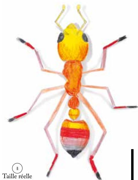
① Taille réelle