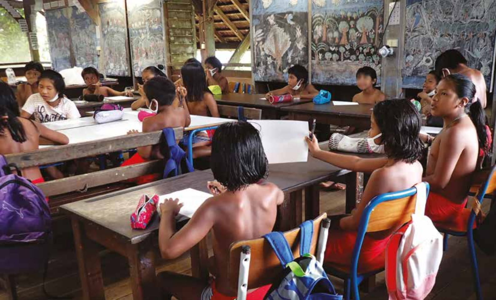
Salle de classe, village d'Antécume Pata - Cliché Claire Villemant.