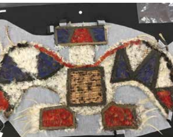
Kunana en forme de chenille géante Kulurwayak au Musée du quai Branly-Jacques Chirac - Cliché Nicolas César

Parmi tous les dessins réalisés par les enfants des différentes écoles 26 ont été sélectionnés pour la qualité de l'illustration. Un concours lancé le 17 janvier dernier sur Facebook, et à l'initiative des dessinateurs de l'équipe, a permis de désigner les deux premiers « coups de cœur » du public : un pour les classes primaires et un pour les collèges.