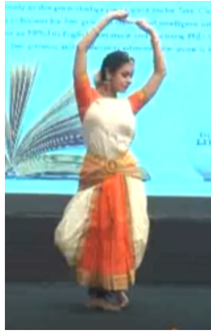
Figure 2 : Danseuse, temple shivaïte Tamil Nadu, D194809773