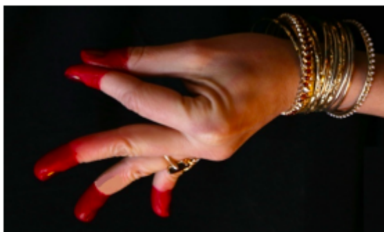
Figure 4 : hamsasya mudrā , Géraldine Nalini, © Jean Grail.