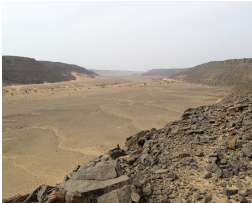
1. Vue générale du lit majeur du Ouadi Abou Soubeira, vers l'aval de la concession (janvier 2013).

Le Ouadi Abou Soubeira est une vallée sèche du désert oriental qui débouche sur la vallée du Nil, à environ 12 km au nord d'Assouan. Il suit une progression globalement est-ouest et s'étend sur environ 55 km dans le désert. Il est connecté à un réseau d'autres vallées semblables, qui permettent une progression jusqu'à la mer Rouge à environ 250 km (à vol d'oiseau) de la vallée du Nil. Il offre donc une voie de passage naturelle entre la vallée du Nil à hauteur de la première cataracte et la mer Rouge. Dans la section qui nous intéresse ici, il est large de 500 m et bordé de falaises d'une centaine de mètres de haut.