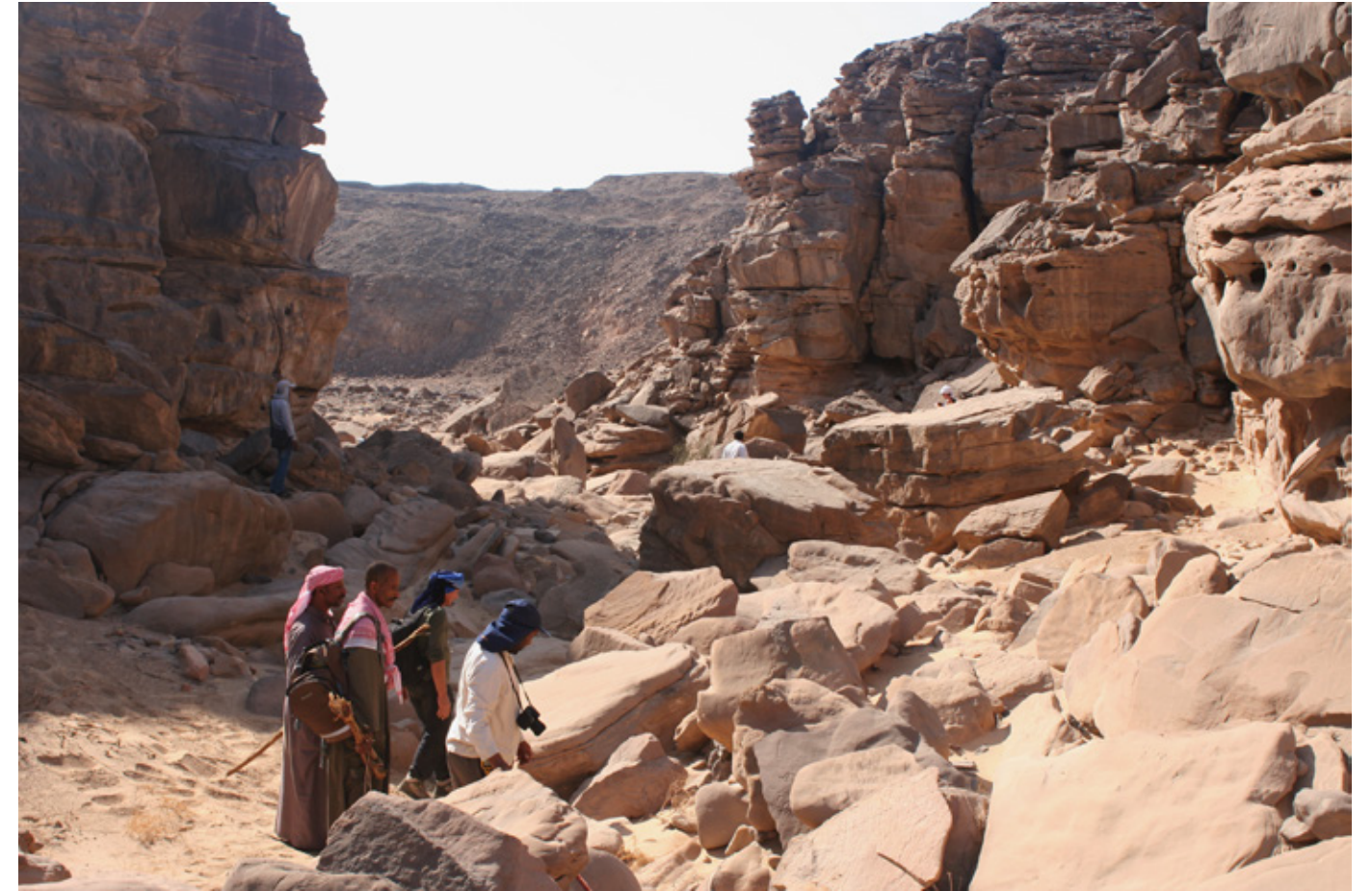
2. Prospections pédestres dans un diverticule du ouadi (janvier 2013).