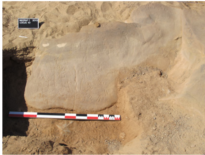
5. Kathryn E. Piquette en train de procéder au relevé RTI de la dalle du locus 10 (janvier 2013).