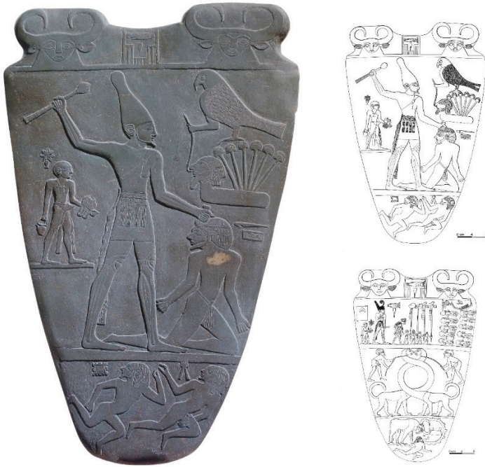
Figure 5. La palette de Narmer (musée égyptien du Caire-.

La plus célèbre d'entre elles, la palette dite de Narmer, montre l'unification du royaume du sud de l'Égypte, avec celui de la Basse Égypte, par la défaite du souverain de ce dernier face au roi Narmer qui porte la couronne de la Haute Égypte. Ces objets qui ne peuvent plus servir à réduire des pigments ou quoi que ce soit, sont devenus des objets de prestige, ceux qu'A. Anselin appelait des powerfacts . Mis à part les palettes historiées de Nagada III qui sont sorties des dépôts cultuels, on trouve fréquemment des palettes dans les tombes, toujours à hauteur de la partie supérieure du corps du défunt, très souvent en face de sa tête.