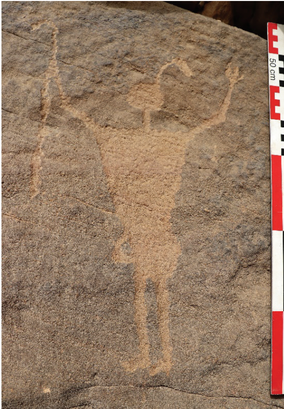
Figure 6. Gravure rupestre du wadi Abu Subeira (désert oriental, région d'Assouan). Personnage triomphant.

sont par ailleurs discrets et silencieux pour l'archéologue. Ils doivent plutôt se déduire en négatif du propos dominant. Vae victis , déjà.