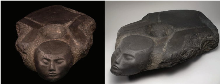
Figure 2. Socle de porte avec figure de prisonnier. Philadelphie, University of Pennsylvania Museum of Archaeology and Anthropology (Numéro d'inventaire : E. 3959).

personnage triomphant s'enorgueillit souvent d'une queue animale accrochée à sa taille. De pareilles représentations existent dans le désert, gravées sur des blocs le long des voies de passage 1 . Le pharaon massacrant ses ennemis sera une figure incontournable de l'iconographie des temples, toujours représentée sur le pylône d'entrée, jusqu'à l'époque romaine.