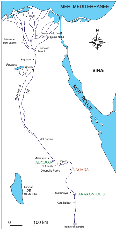
Figure 1a. L'espace nagadien