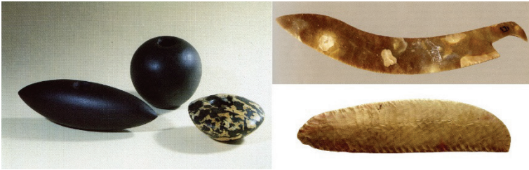
Figure 4. Tête de massue et lames de silex taillé (couteau au nom du roi Den, en provenance de Minshat Ezzat, conservé au musée égyptien, longueur 48,3 cm et ripple flake de Nagada II-III, conservé à Chicago, à l'Oriental Institute Museum, numéro d'inventaire E10533)

Lorsque des armes réelles, portant ou pas des traces d'usure, sont retrouvées, on ne peut que constater, par leurs formes, leurs couleurs, leurs matières premières, le fort investissement esthétique dont elles ont fait l'objet. Lames en silex blond montrant un niveau de savoir-faire rarement égalé, utilisation de pierres avec des effets de matières ou de polychromie, comme la brèche et le porphyre, élégance des formes géométriques très épurées, elles comportent de multiples aspects non immédiatement liés à leur efficacité.