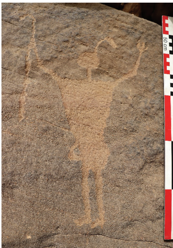
Figure 6. Gravure rupestre du wadi Abu Subeira (désert oriental, région d'Assouan). Personnage triomphant.

sont par ailleurs discrets et silencieux pour l'archéologue. Ils doivent plutôt se déduire en négatif du propos dominant. Vae victis , déjà.