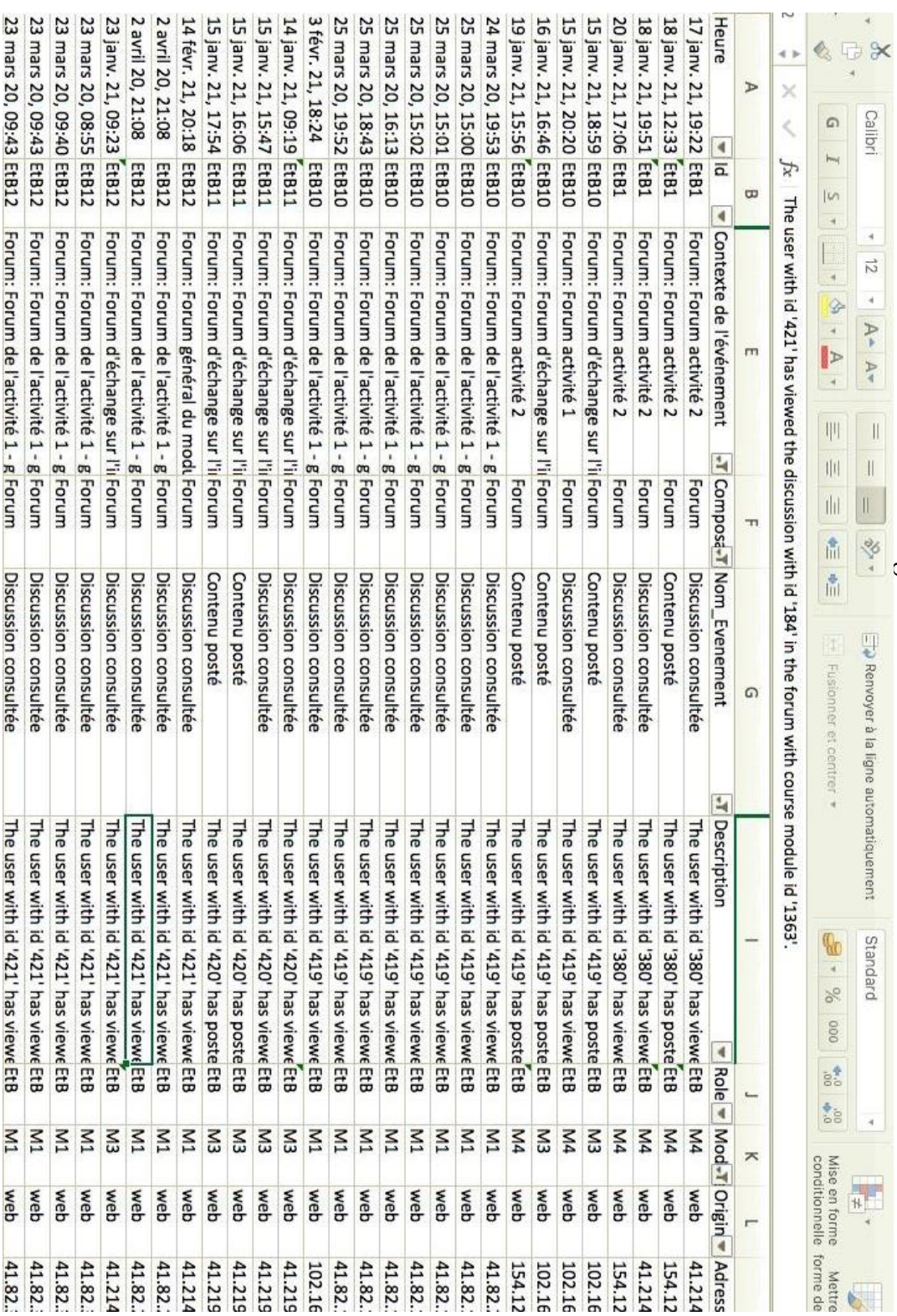
Figure 2 : Capture d'écran du contenu du fichier log