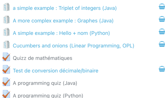
FIGURE 2. Exemple d'une section de cours visitable : les activités partagées peuvent être ajoutées au panier du visiteur qui peut ensuite les insérer dans son cours.

loin d'être négligeable. D'un côté, les nouveaux arrivants peuvent s'appuyer sur des contenus existants pour se mettre le pied à l'étrier, que ce soit en les intégrant dans leurs enseignements, en les utilisant comme base pour construire leur espace ou simplement comme exemple pour adapter leurs propres ressources. Pour les utilisateurs plus expérimentés, au-delà du gain de temps apporté par le réemploi de ressources, la perspective du partage ajoute un sens supplémentaire aux efforts de conception (on ne travaille plus uniquement pour soi et ses élèves, mais si on le souhaite, pour le bénéfice de la communauté) et conduit à terme à une amélioration de la qualité des ressources produites, via les relectures et retours des enseignants intéressés.