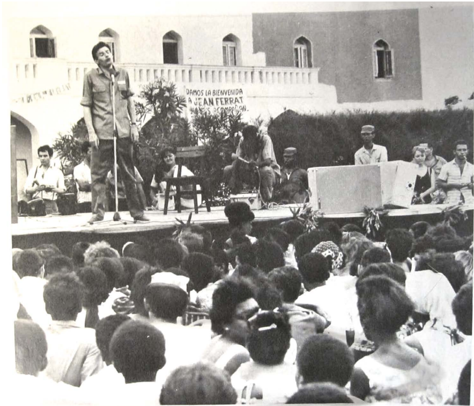
Ill. 3. La vedette rouge : Jean Ferrat, pendant sa tournée à Cuba (été 1967).