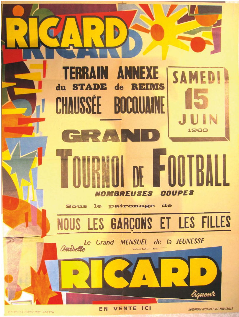
Ill. 5. Une affiche pour un tournoi de football à Reims en juin 1963 « sous le patronage de NGF ».

Le mensuel est bien sûr présent dans toutes les manifestations culturelles organisées par les unions du MJCF (ou auxquelles il est associé) : cérémonies (remise des cartes, vins d'honneur...), galas et fêtes (du quartier à celle de L'Humanité, via celles de la JC), concours artistiques et compétitions sportives, crochet des « Relais de la chanson française. Sur ce crochet, voir Jedediah Sklower, « Le dispositif musical du Mouvement de la jeunesse communiste de France (1956-1968) : prescription culturelle et gouvernementalité militante », Territoires contemporains , n° 11, 2019, en ligne : http://tristan.u-bourgogne.fr/CGC/publications/prescription-culturelle-question/Jedediah-Sklower.html (AD93, Fonds MJCF, 133 FI 1963-1985).