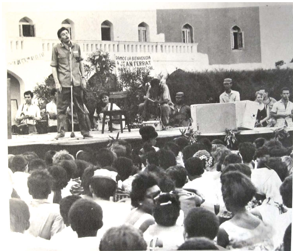
Ill. 3. La vedette rouge : Jean Ferrat, pendant sa tournée à Cuba (été 1967).