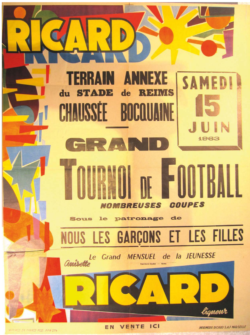
Ill. 5. Une affiche pour un tournoi de football à Reims en juin 1963 « sous le patronage de NGF ».

Le mensuel est bien sûr présent dans toutes les manifestations culturelles organisées par les unions du MJCF (ou auxquelles il est associé) : cérémonies (remise des cartes, vins d'honneur...), galas et fêtes (du quartier à celle de L'Humanité, via celles de la JC), concours artistiques et compétitions sportives, crochet des « Relais de la chanson française. Sur ce crochet, voir Jedediah Sklower, « Le dispositif musical du Mouvement de la jeunesse communiste de France (1956-1968) : prescription culturelle et gouvernementalité militante », Territoires contemporains , n° 11, 2019, en ligne : http://tristan.u-bourgogne.fr/CGC/publications/prescription-culturelle-question/Jedediah-Sklower.html (AD93, Fonds MJCF, 133 FI 1963-1985).