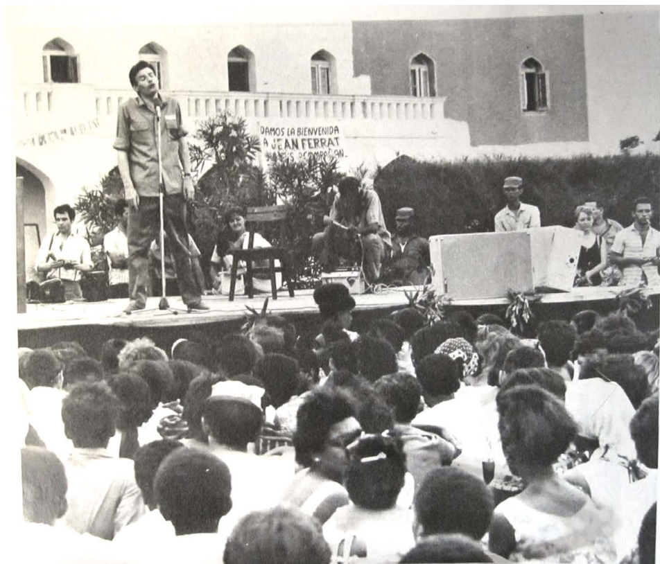
Ill. 3. La vedette rouge : Jean Ferrat, pendant sa tournée à Cuba (été 1967).