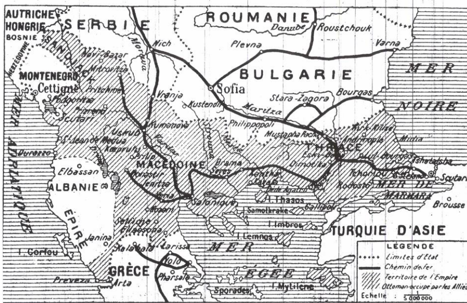
Carte 3 : Carte de l'Albanie (Source : Le Figaro , 23 janvier).