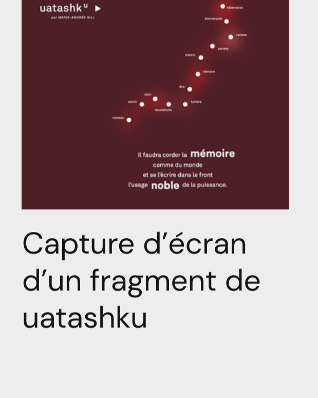
Capture d'écran d'un fragment de uatasku