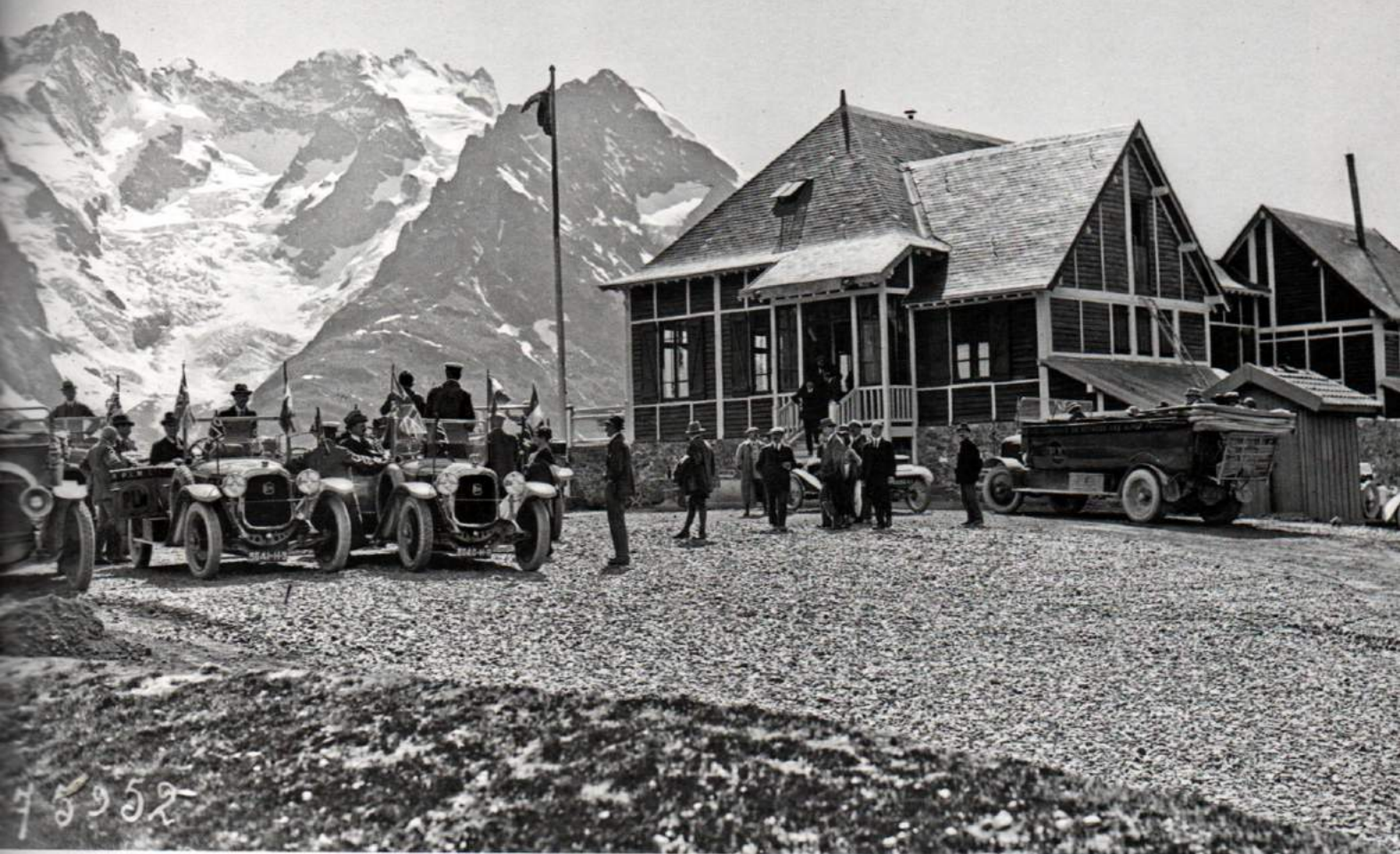
En 1922, un bataillon d'autocars attend les voyageurs devant le chalet-hôtel PLM du col du Lautaret (Hautes-Alpes).

En effet, l'appellation actuelle de route des Grandes Alpes date seulement de 1950. Et l'hypothèse de la route entière érigée comme lieu touristique renvoie même sans doute à des datations plus récentes. Quatre boucles appelées variantes sont ainsi venues se greffer au tracé originel et ont permis d'intégrer des cols routiers supplémentaires, comme celui de la Croix de Fer ou de la Bonette, ainsi que des circuits vers les lacs d'Annecy et de Serre-Ponçon.