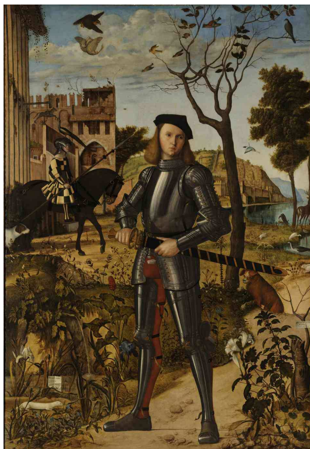
fig. 2: Vittore Carpaccio, ritratto di Cavaliere, possibilmente il principe di Capua Ferrandino

Vive nel palazzo di Federico d’Aragona, che lo accoglie fuori della città 17 . Si reca una prima volta il 12 novembre a Pozzuoli per incontrare il