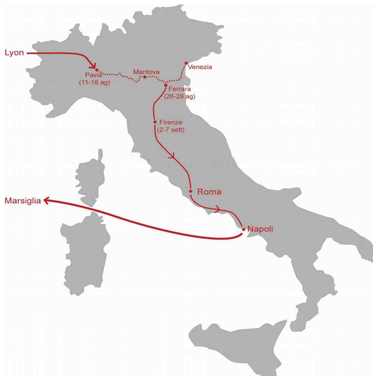
fig. 1: itinerario di Guillaume de Poitiers nel 1489

che sarebbe “più tosto uno zintilhommo che sia venuto aspazzo per vedere Italia, cerchando de havere qualche comissione dal Christianissimo Re de Franza, che essere venuto per altre speciale comissione chel habia” 4 . Un viaggiatore insomma che viene in Italia anche per motivi privati.