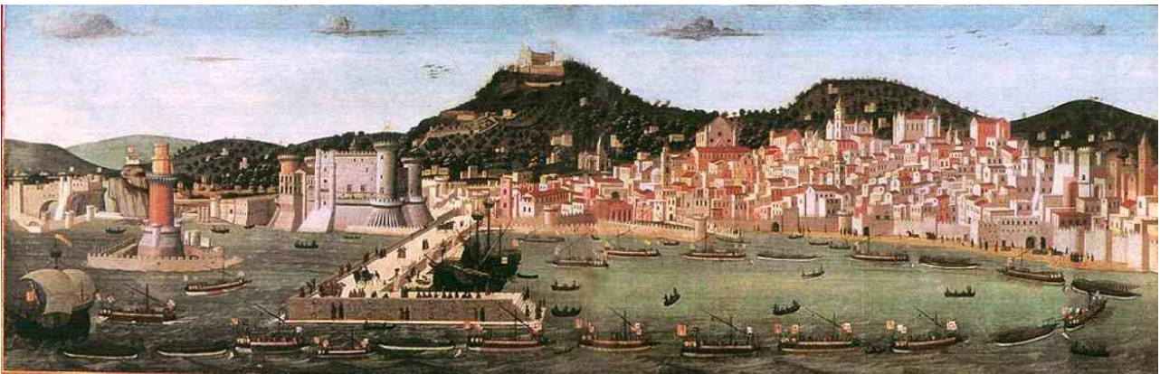
fig. 3: tavola Strozzi, Napoli alla fine del Quattrocento

La caccia è un'attività importante alla corte aragonese. È l'occasione di scambi formali come ad esempio il 24 novembre, quando Guillaume de Poitiers accompagna il duca, il re e la regina “et fu facta bella caccia et ce fureno morti cervi XV et uno lupo et altre fere selvatiche”. Questa attività genera anche momenti di socialità più informali come ad esempio una mattina in cui l'ambasciatore incontra il duca “ad stabula sua [...] et vide soi cavalli. Et illis visis domum reversus ad negocia” 20 . I cavalli sono un regalo diplomatico: all'arrivo dell'ambasciatore francese, quattordici “belli corsieri” sono stati spediti da Alfonso al re Carlo VIII 21 .