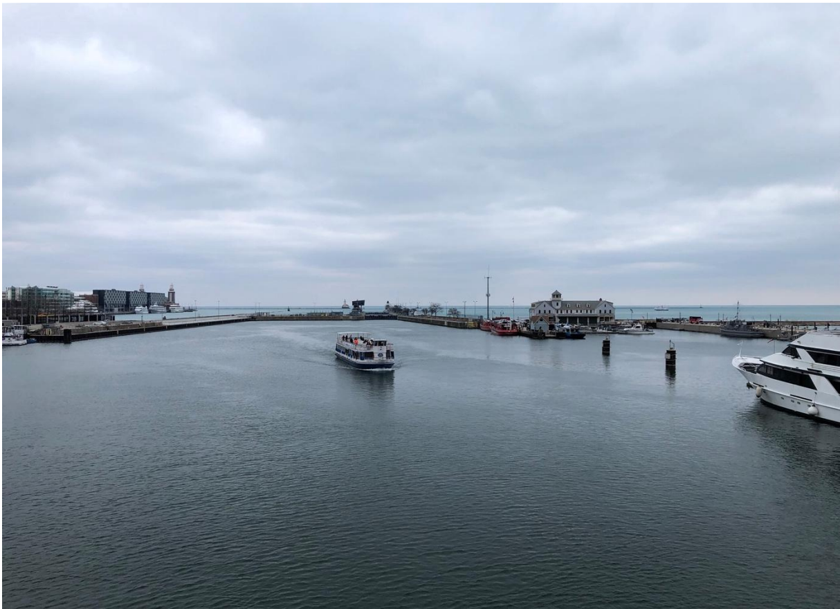
Figure 1 Chicago Rivers Locks

Je viens de passer un mois à Chicago, à l'écoute des écologies urbaines. Pendant ce mois j'ai marché chaque jour le long des rivières qui traversent la ville. Les rivières sont connectées au Lac Michigan mais leur cours a été inversé à la fin du XIX e siècle. En d'autres termes les rivières coulent depuis 100 ans à contre-courant. Depuis la fondation de la ville, l'histoire de ces rivières est intrinsèquement liée à celle de Chicago. S'intéresser à elles, les donner à voir c'est participer à rendre visible le contre champ environnemental de la fabrique des métropoles modernes. C'est en marchant le long des berges, en documentant cette enquête par la photographie et la vidéo que j'ai proposé d'interroger l'actuel statut écologique et social de ces rivières ainsi que leur place dans la métropole et dans son devenir. En plus de ces marches, j'ai aussi rencontré un grand nombre d'acteurs impliqués dans la gestion quotidienne, scientifique ou prospective de ces rivières. Je propose ici un bref aperçu de ces explorations.