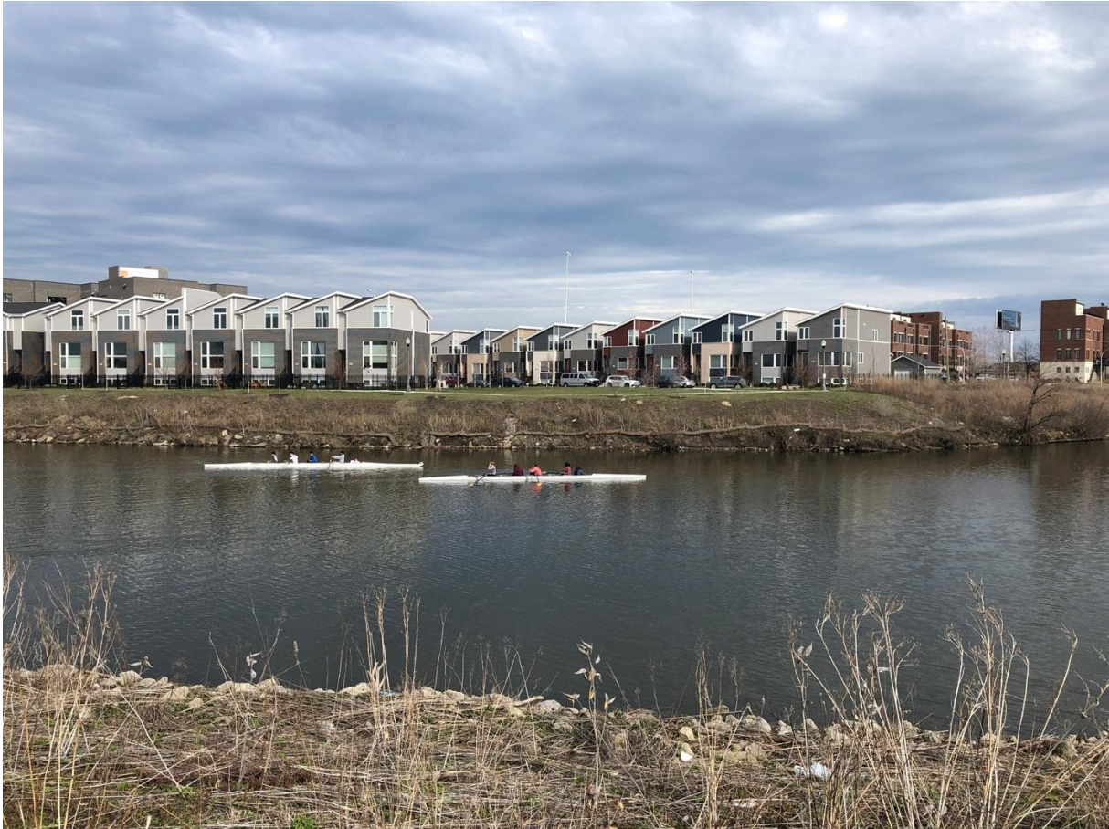
Figure 8 Avirons sur Bubbly Creek