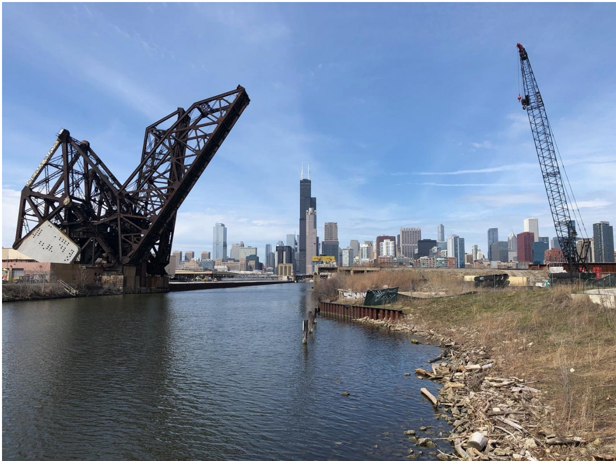
Figure 9 South branch depuis Ping Tom Memorial Park