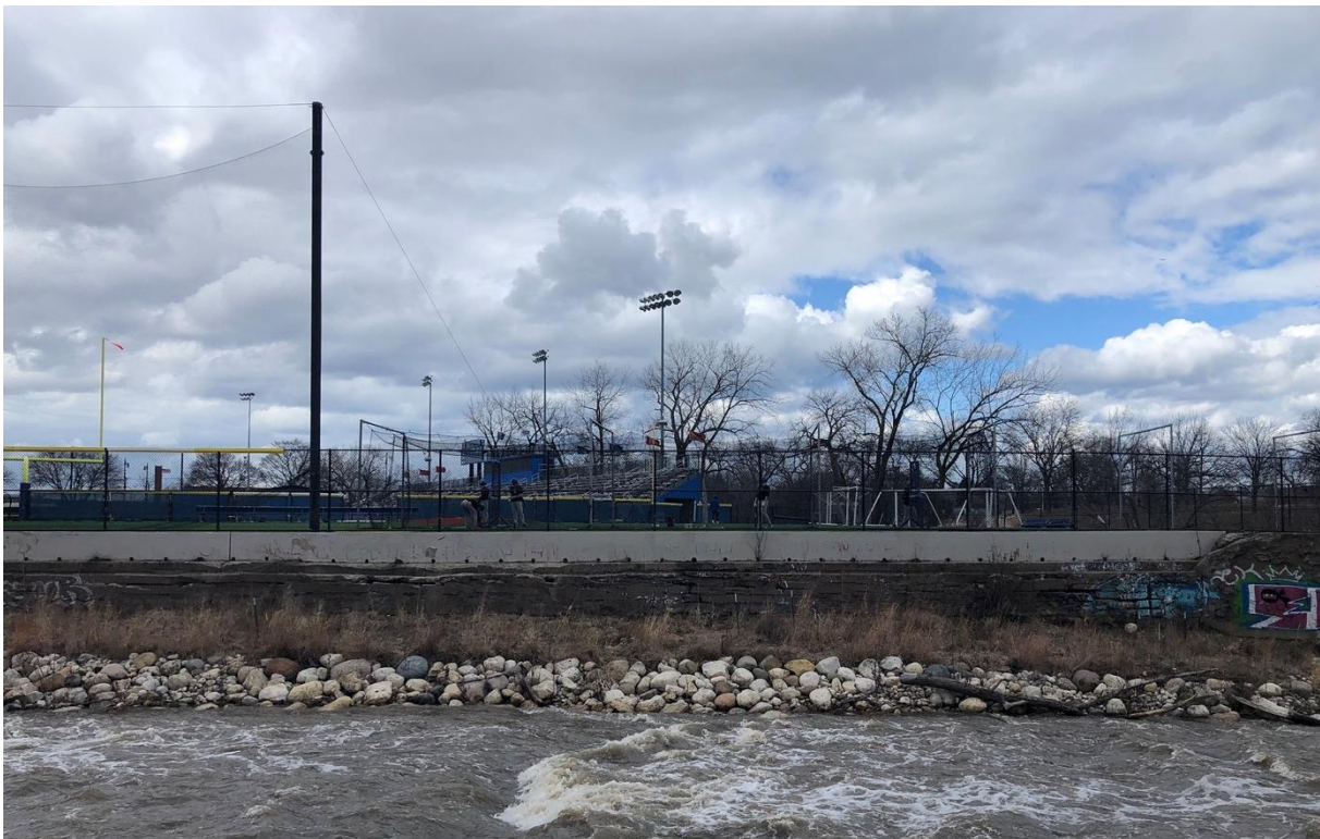
Figure 5 Chicago River et North Shore Channel à Robert Park

La branche Nord de la Chicago River et le North Shore Channel se rejoignent à Robert Park, dans le Nord de Chicago. Il s'agit là justement d'un exemple de renaturation de la rivière et de ses berges. Si la photo avait été prise en 2018, on y aurait vu un barrage traverser toute l'image. Demandée dès les années 2000, la suppression de ce barrage en béton de quatre pieds de haut (soit environ 1,20 m) a été approuvée et réalisée par le corps des ingénieurs de l'armée américaine. Ce barrage avait été construit en 1910 pour compenser la différence de niveau entre la branche Nord de la Chicago River et le North Shore Channel, causée par l'inversion du cours de la rivière Chicago dix ans plus tôt. Aujourd'hui, le barrage a été remplacé par des radiers qui ralentissent le débit de l'eau et ouvrent un passage pour que les poissons puissent nager en amont. Mais ce n'est pas la seule amélioration apportée au River Park. Les plantes et fleurs sauvages indigènes ont progressivement été