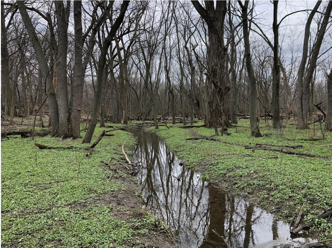
Figure 7 LaBagh Woods