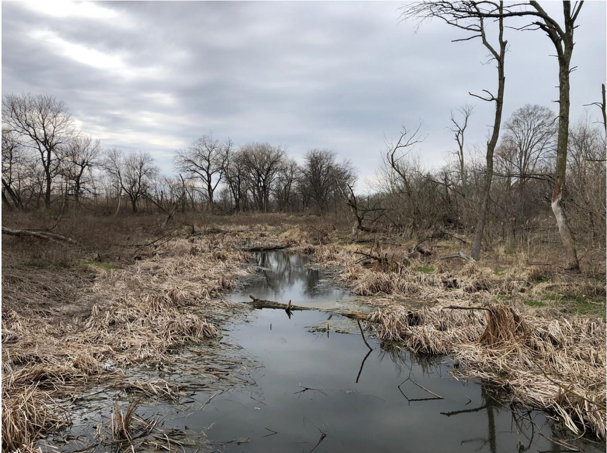
Figure 3 Chicago Portage National Historic Site