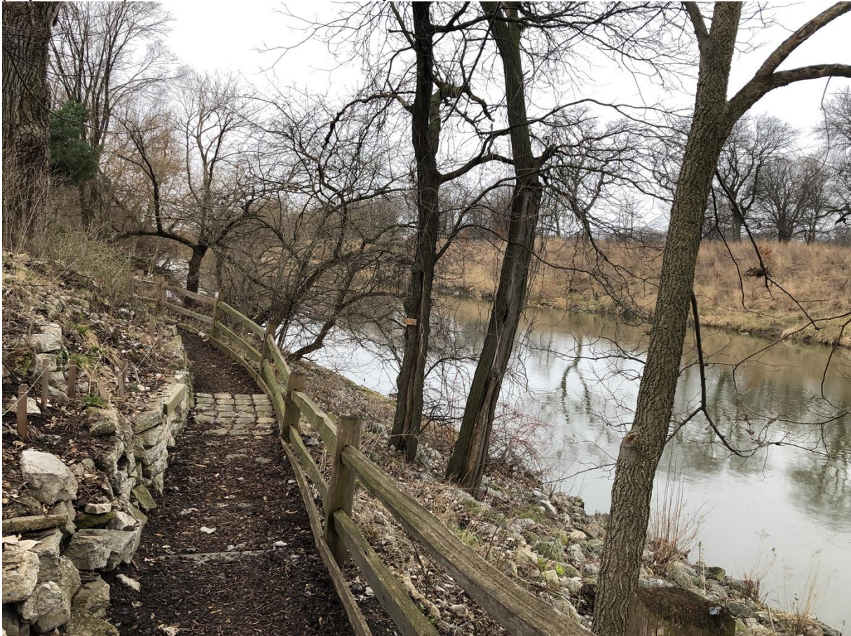
Figure 6 Riverbank Neighbors Park en face de Horner Park

réintroduites sur les berges. Les ingénieurs de l'armée œuvrent ici en faveur de la restauration des écosystèmes. Plus loin, ce sont des riverains qui opèrent eux-mêmes cette renaturation des berges. D'autres projets, comme le Wild Mile Chicago par exemple, s'inscrivent aussi dans cette dynamique, celle de la renaturation des rivières et potentiellement celle de la renaissance du grand système de rivières de l'aire métropolitaine. Je me demande cependant dans quelle mesure l'accumulation de ces projets locaux permettra-t-elle de modifier le système dans son ensemble ?