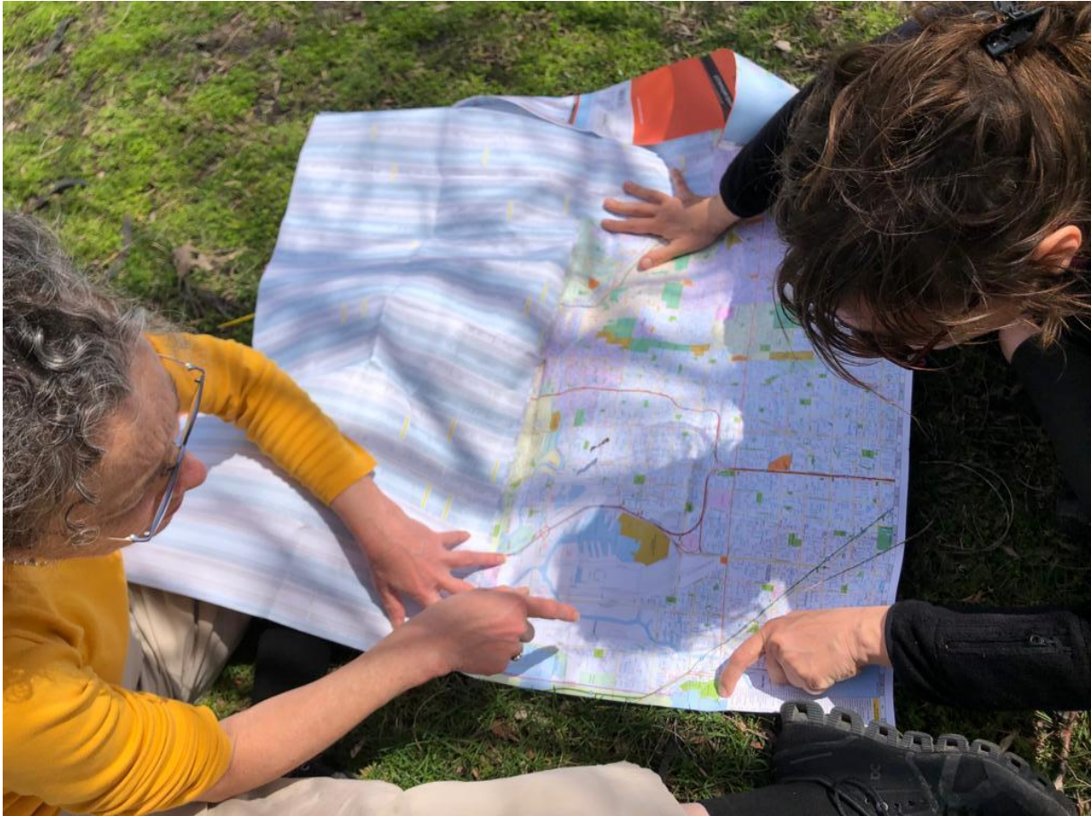
Figure 10 Co-construction d'un itinéraire de marche autour de Calumet River

En guise de conclusion je souhaite ici revenir sur la question qui m'anime. La rivière a joué un rôle central dans la fondation et la croissance de la ville de Chicago. Est-ce qu'elle jouera un rôle tout aussi important dans le futur ? À quelles conditions pourra-t-elle se retrouver au centre du tournant écologique de la fabrique métropolitaine ? À l'heure actuelle, il s'agit d'un vaste système hydrographique entièrement artificialisé qui fait essentiellement officie d'arrière scène technique de la métropole bâtie et habitée. Si aujourd'hui on peut constater que la reconquête urbaine est à l'œuvre, je fais aussi le constat que celle-ci est très morcelée et ne repose pas sur un vison programmatique – notamment écologique – d'ensemble. Pour autant, j'ai la conviction que les rivières demeurent ici un formidable potentiel pour un projet collectif et démocratique à même d'opérer la métamorphose environnementale de cette métropole moderne.