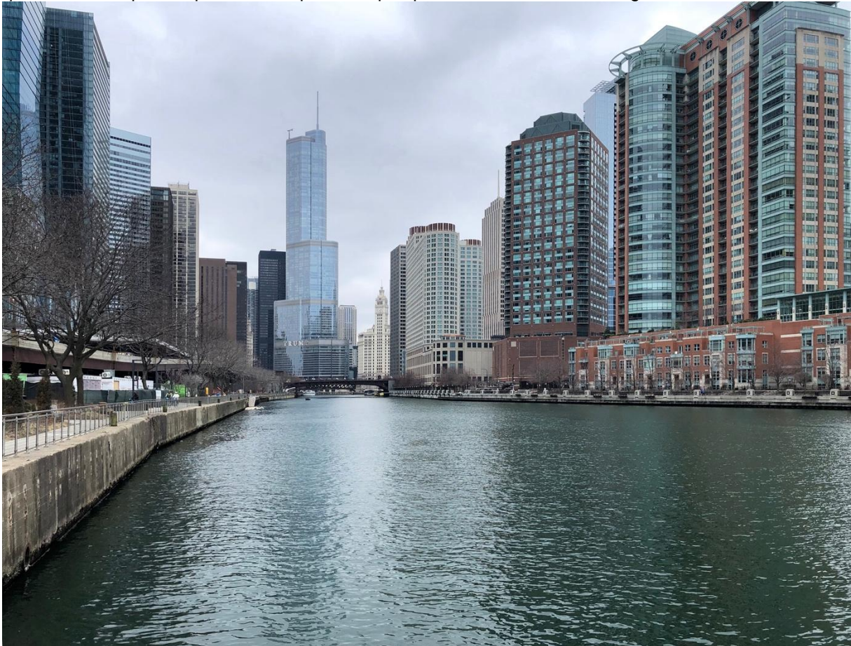
Figure 2 Main Stem

situation inédite - ont contraint les autorités locales à chercher une solution. Celle-ci aboutit en 1900 à l'inversion du cours de la rivière qui va maintenant se jeter - artificiellement - dans le Mississippi et donc dans le golfe du Mexique tout au Sud des États-Unis. Cette première image donne donc à voir ce qui était autrefois l'embouchure de la rivière et qui en est aujourd'hui la source. Quelles relations la ville et les riverains peuvent-ils avoir avec une rivière qui est à ce point une infrastructure artificielle et qui traverse de part en part la métropole sur quelques 274 kilomètres de long ?