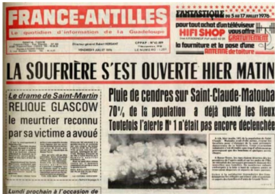
Figure 2. Une du France Antilles du 9 juillet 1976.