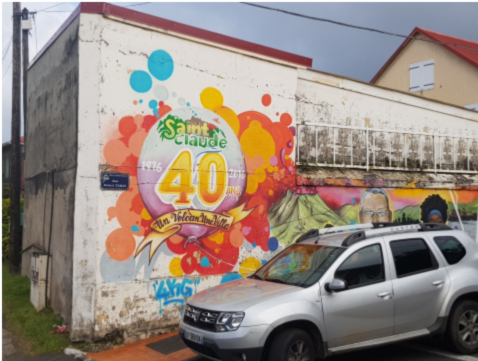
Figure 5. Fresque réalisée à Saint-Claude pour l'anniversaire des 40 ans, qui s'intitule « Saint-Claude, ville de volcan 1976-2016 ».

44 Il n'existe enfin aucun lieu mémoriel pérenne indiquant les éruptions passées de la Soufrière, sur le volcan lui-même. Le sentier de randonnée est jalonné de panneaux (figure 6) à visée pédagogique, sur les manifestations éruptives ou sur la présence de tel ou tel site remarquable (« gouffre de Tarissan » ou la « Grande Faille »). Mais la crise éruptive de 1975-1977 n'est pas mise en avant.