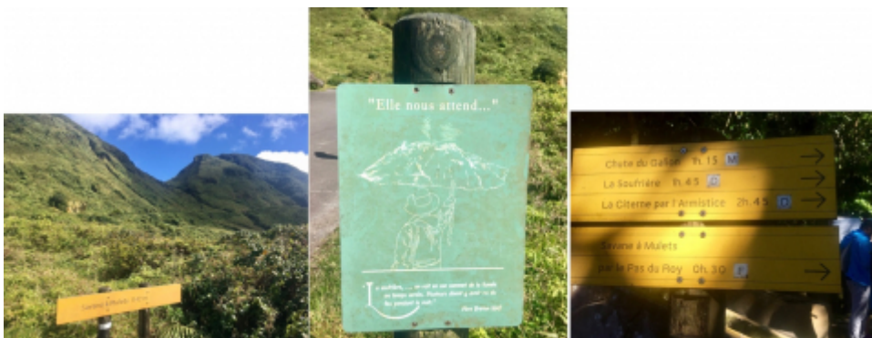
Figure 6. Exemples de panneaux le long du sentier de randonnée de la Soufrière.