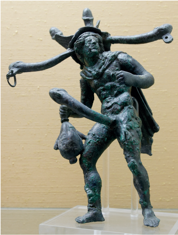
Fig. 2 : Tintinabulum représentant un Mercure ityphallique. Son pétase supporte également quatre phallus. Cabinet Secret du Musée Archéologique National de Naples, inv. 27854, © Marie-Lan Nguyen / Wikimedia Commons / CC-BY 2.5.

Cela fait, il demeure une très grande variété d'objets et de supports affichant l'image d'un phallus et pouvant être classés comme des fascina : pendentifs [45], pendeloques de harnachement [46], tintinnabula [47] – c'est-à-dire des carillons éoliens –, gravures [48], mais également fresques, mosaïques [49], bijoux, statuettes, vaisselles et lampes [50]. La plupart, notamment les pendentifs, représentent un simple phallus, détaché de tout corps [51]. Certaines amulettes, présentent des biphallus ou des triphallus, probablement pour accroître leur efficacité [52]. Il faut comprendre de la même manière les combinaisons associant au phallus un autre symbole apotropaïque [53]. Les pendentifs de Catterick [54] (fig. 1), par exemple, présentent un