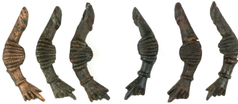
Fig. 1 : Ensemble de pendentifs figures et phallus, trouvés dans une tombe d'enfant à Catterick (North Yorkshire, UK), Accession number YORYM:1980.54.9464.1-6.

C'est bien la raison pour laquelle les diverses amulettes, comme on les appelle, passent pour servir de protection contre cette sorte de malveillance : leur aspect étrange attire le regard du fascinateur et l'empêche ainsi de se fixer sur sa victime [40].