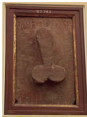
Fig. 4 : Relief en travertin avec phallus et inscription « hic habitat felicitas », provenant de la boulangerie de l'îlot de la Casa de Pansa, Pompéi. Musée Archéologique National de Naples, inv. 27741.

Les ornements personnels et les pendeloques de harnachement ne devaient pas être plus discrets. Les pendeloques, qui sont des pièces de décorations assez grandes, étaient certainement agitées par les mouvements du cheval. Certaines étaient même agrémentées de clochettes ou de pendants foliacés dont les tintements, à l'instar des tintinabulla , devaient attirer l'attention. Les pendentifs pouvaient en revanche avoir été portés sous la tunique, afin d'être dissimulés, mais plusieurs éléments poussent à écarter cette possibilité.