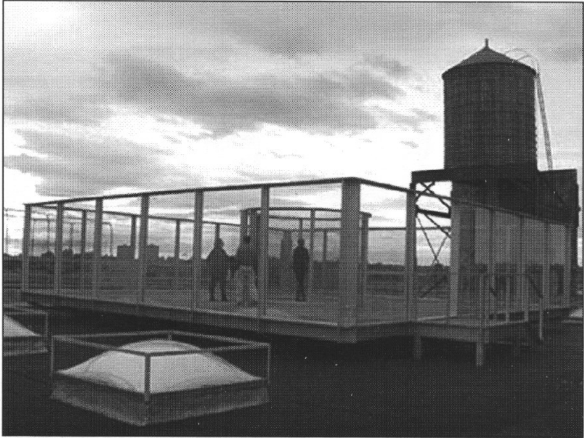
Illustration 2. Dan Graham, Two way Mirror Cylinder Inside Cube . © Studio of Dan Graham, Inc.