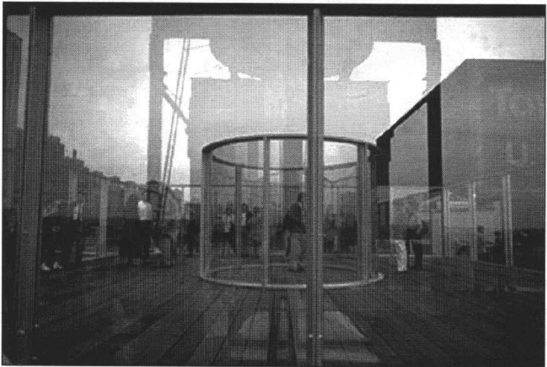
Illustration 1. Dan Graham, Two way Mirror Cylinder Inside Cube . © Studio of Dan Graham, Inc.