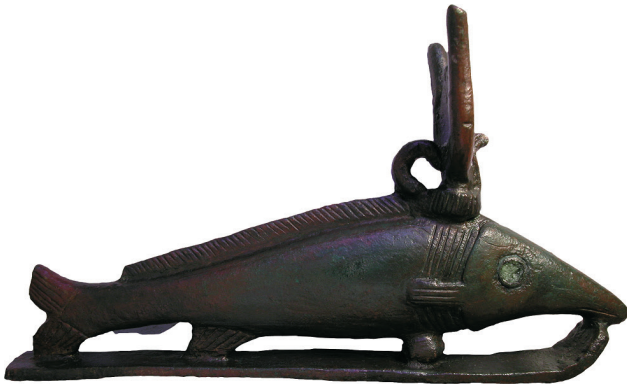
Fig. 1 : Figurine en bronze du poisson oxyrhynque avec coiffe hathorique, Basse Époque, 18 cm (Fig 2001.18).

et constituait ainsi une émanation du dieu, ou comme l'indique J.P. Corteggiani, « un reliquaire vivant » [25]. Ce mythe autour de la perte du phallus d'Osiris traduit le second grand aspect dévolu au sexe masculin : son symbole de pouvoir et d'autorité. L'émasculatation d'Osiris correspondait à la perte momentanée de son pouvoir, consécutive à sa mort. Ce symbolisme lié à la perte de l'organe sexuel masculin était clair pour les Égyptiens qui, dès la plus haute antiquité, pratiquaient l'émasculatation de leurs ennemis après leur mort, afin de leur enlever toute possibilité de survie posthume [26]. Une transposition de cette pensée se retrouve dans certains livres funéraires royaux qui présentent à l'occasion les damnés appelés « les ennemis d'Osiris » à la fois décapités et émasculés pour signifier qu'ils sont voués à une seconde mort définitive consistant à leur retour dans la « non existence », le chaos [27]. La mort d'Osiris marquait la mise en danger de la succession au trône par le dieu incarnant la mort, Seth. Comme tout défunt, Osiris se retrouvait à la merci des Vivants et nécessitait leur aide pour surmonter cette étape difficile [28].