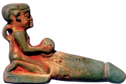
Fig. 3 : Figurine érotique en faïence du type Ptah patèque, Basse Époque, 3.3 x 5.1 cm (ÄA 1983.0973).

Des momies, que le hasard et la chance ont bien voulu préserver, dont l'une possédant une marque claire de coupure de ses genitalia , ont été pourvues d'une amulette en forme de phallus placée au niveau du pelvis ou directement entre les jambes de la momie [43]. Il est clair que de telles amulettes devaient suppléer magiquement à l'absence de phallus si tel était le cas et, de manière générale, restituer sa fonction (fig. 2). En ce sens, l'utilité de l'amulette en forme de phallus est tout à fait comparable à celle d'autres amulettes en forme de partie du corps humain, tête, jambe, main, cœur, entre autres, qui elles aussi, pouvaient renforcer ou remplacer un organe / membre défaillant, et contribuer à retrouver une forme d'intégrité permettant au défunt de poursuivre une vie posthume dans l'au-delà [44]. La crainte de la perte de la libido masculine explique le recours à l'efficacité magique des amulettes phalliques et autres erotica faisant partie du matériel funéraire (fig. 3) [45]. Dans un cas, une momie a vu son pénis et ses testicules coupés puis traités séparément pour être préservés dans une statuette d'Osiris en bois doré, elle-même placée dans la cavité abdominale, une pratique qui remonterait à l'époque ramesside [46].