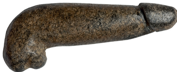
Fig. 2 : Amulette phallique en pierre, Basse Époque, 3 cm (ÅA 1983.1251).

Les organes triomphants de certaines momies révèlent, lors de radiographies, qu'il peut s'agir de prothèses constituées, dans un cas exceptionnel, d'une grenouille momifiée, fortement connotée à la notion de génération spontanée et de vie éternelle [40], mais plus généralement faites avec du lin trempé dans de la résine par exemple [41]. Dans le cas où l'organe est encore conservé, il se présente circoncis dans la grande majorité des cas et ceci à toutes les époques de l'histoire égyptienne [42].