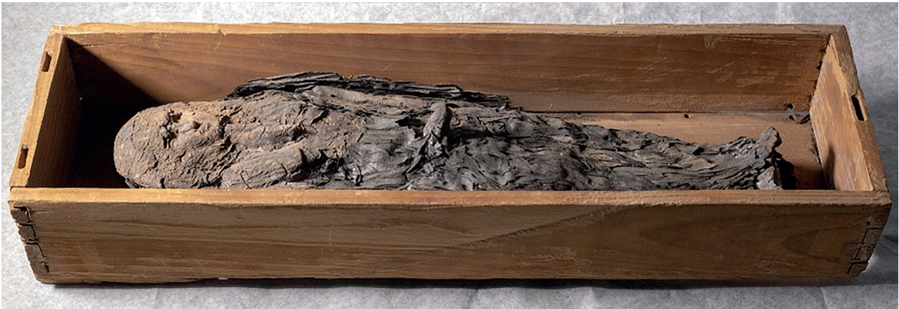
Fig. 4a : Figurine osirienne du type « Sokaris », avec traces d'emballage en étoffe au niveau des pieds, 47 cm (Fig. 2010.2).