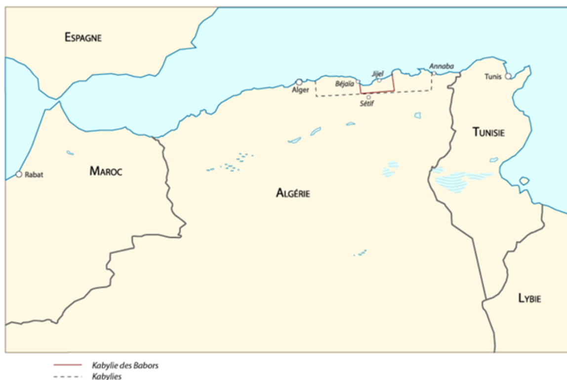
Carte 1 : situation de la Kabylie des Babors

Les Aït Mâad (ou Bni Mâad 1 ) sont une confédération située au cœur de la Kabylie des Babors à même le sahel jijélien (commune de Ziama-Mansouria, province de Jijel) (voir Carte 1 et 2). Cette communauté occupait un territoire très accidenté, composé de montagnes, de falaises littorales, et d'une presqu'île: la Mansouria 2 . Durant la guerre de libération, l'arrière-pays des Aït Mâad vit sa population diminuer par petite vague, entre expropriations forcées par le colonisateur et abandon de terres restées complètement dépourvues. Cet exode se solda il y a deux décennies par une désertion totale causée par la guerre civile algérienne des années 1990. Beaucoup de Mâadis rejoignirent la Mansouria, tandis que d'autres prirent le chemin de l'exil vers Jijel ou Alger.