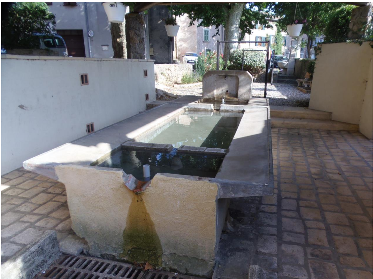
Fig.1 – Le lavoir en eau après une fête du village. Dans le fond, l'étendoir.

Les bancs sont plutôt occupés les nuits d'été, une fois le linge enlevé. Le bassin couvert abrite plus fréquemment les groupes d'adolescents pendant la période scolaire, à la descente du car, et pour des haltes plus ou moins longues. C'est sans doute là que l'espace est ressenti comme une cabane, qu'il y a plusieurs sous-espaces, qu'il y a un dedans et un dehors. Sa fréquentation par des adolescents a débuté au moment de la fermeture de l'eau. L'espace d'intimité est le bassin parce qu'il est relativement petit et qu'il permet le vis-à-vis en s'asseyant sur les deux rebords plats, là où on savonnait le linge autrefois. Pour que les conversations soient possibles, le chevalet du lavoir, c'est-à-dire la planche qui surmonte le bassin et qui servait à placer le linge en cours de rinçage, a été enlevé. Canettes et cartons de pizzas sont posés au-dessus du bloc de pierre d'où jaillissait l'eau. Le bassin rapproche les corps d'autant qu'en début de soirée l'endroit est dans la pénombre, tout juste éclairé de biais par un lampadaire éloigné.