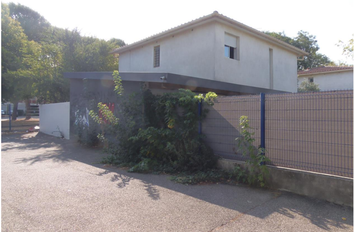
Fig.2 – Le mur aux graffiti, en brun, derrière la végétation

Sur le côté du collège existe un petit parking cerné sur deux côtés par un grillage mais incluant le mur extérieur d'un garage (fig.2). L'endroit est très peu utilisé pour le stationnement des voitures. La zone est l'un des rares espaces du collège qui soit à l'abri des regards. Elle est fréquentée par des collégiens avant et après les cours et représente aussi un point de ralliement le mercredi après-midi. Garçons et filles n'y sont jamais nombreux et l'espace sert pour fumer, discuter et s'exprimer sur le mur ou lire les précédentes inscriptions. La partie gauche de ce mur est la zone la plus "graffitée" car la plus cachée et l'endroit devant lequel les adolescents mangent et abandonnent emballages et canettes. Plus on s'en éloigne, plus les reliquats de repas sont rares. Implicitement, le mur et l'angle formé avec la haie sont l'espace de sociabilité. Le reste du petit parking n'est pas du tout investi. Dans le même temps, cet angle est la zone censée être la plus "abritée", censée seulement car elle est simplement matérialisée par un grillage et une haie végétale derrière lesquels s'étend un petit jardin privatif. Les propos des individus placés à cet endroit sont entendus des propriétaires du jardin qui d'ailleurs s'en plaignent. Les collégiens ressentent simplement cet angle comme un espace clos, comme une cabane, d'où leurs gestes et leurs paroles ne sortent pas.