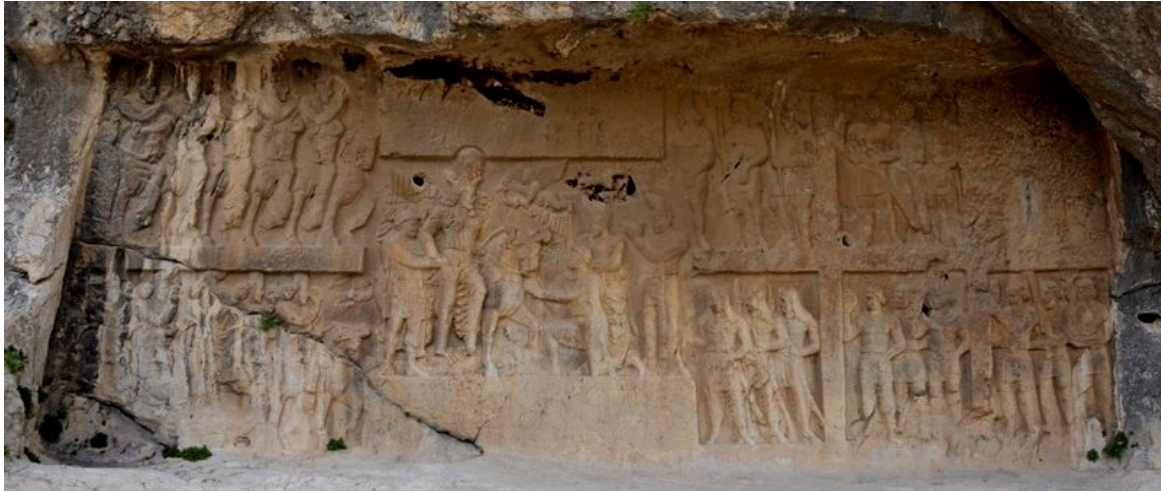
FIG. 7 : Relief de Šāpūr I er à Bišāpūr (Bi II).