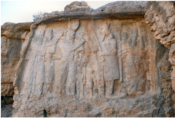
FIG. 15 : Relief d'Ardāšīr I er à Naqš-e Rajab (NRa VI).

corps d'élite et comme pivot stratégique pour gagner la bataille 58 . Avec le relief d' Ardāšīr I er à Naqš-e Rostam, c'est le roi comme chef de guerre qui est célébré, le roi comme chef de guerre victorieux puisque la bataille est passée, l'ennemi est vaincu et le roi peut aller au pas prendre le symbole de son pouvoir légitime. Plus largement, dans les reliefs rupestres sassanides, la figure du roi-cavalier est celle du chef de guerre, toujours victorieux, que le moment représenté se situe après la bataille, le cheval du roi calme et au pas, en marche de dressage, ou au cours de la bataille, comme dans le cas des joutes équestres, le cheval du roi lancé au galop volant sur l'ennemi.