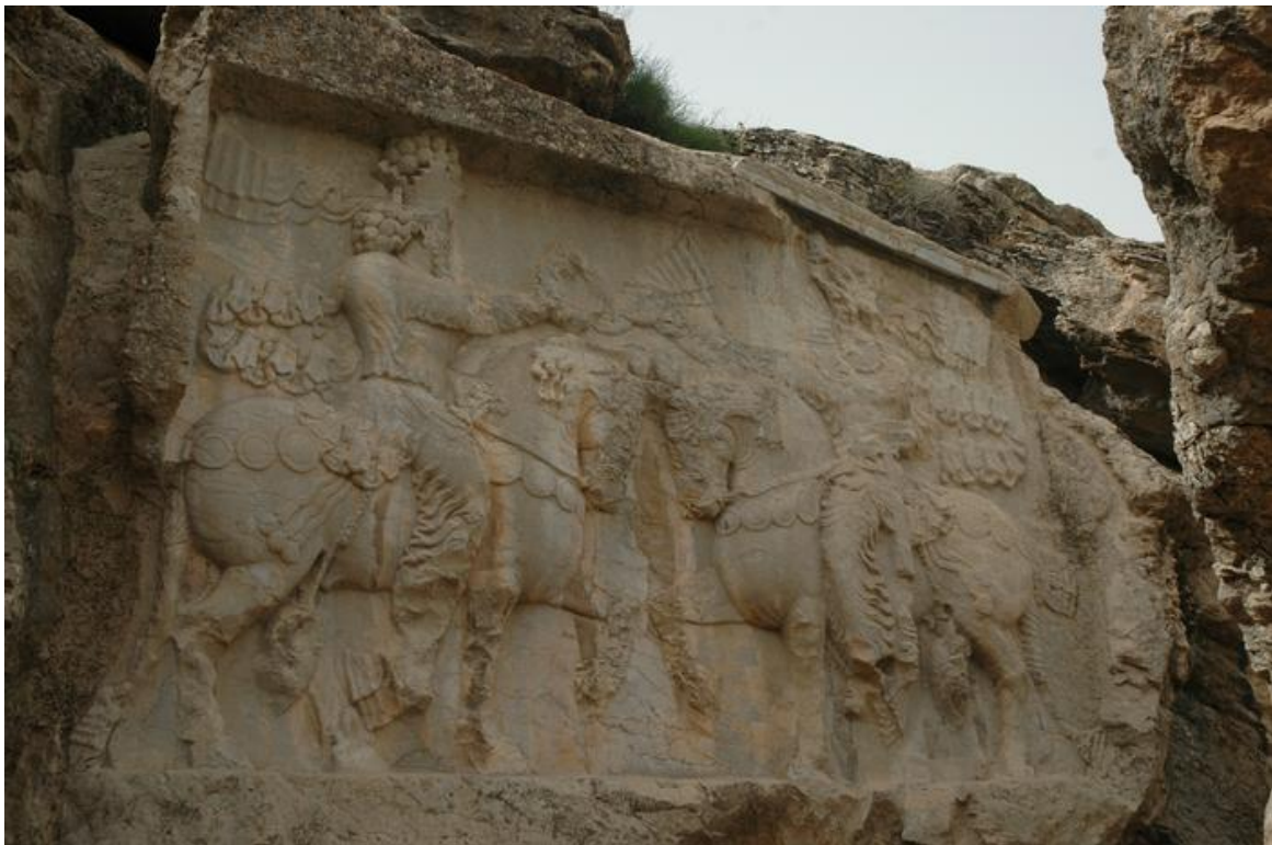
FIG. 4 : Relief de Šāpūr I er (à gch.) à Naqš-e Rājab (NRa I), investiture, source : livius.org, CC0 1.0 Universal, Marco Prins.