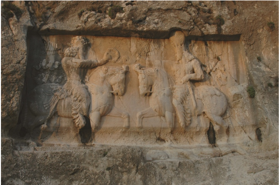
FIG. 9 : Relief de Wahrān I er à Bišāpūr (Bi V).