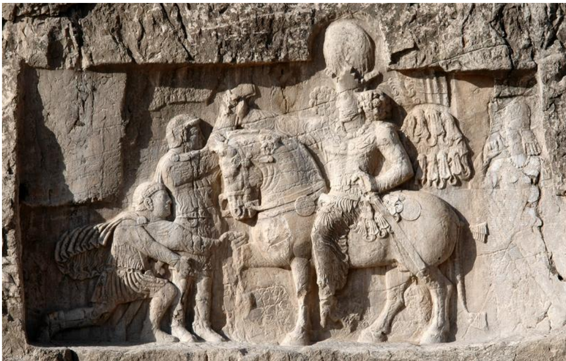
FIG. 6 : Relief de Šāpūr I er à Naqš-e Rostam (NRu IV), supplication de Philippe l'Arabe et capture de Valérien.