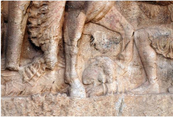
FIG. 16 : Détail du relief de Šāpūr I er dans la gorge de Chogan (Bi I), le cheval de Šāpūr piétinant le corps de Gordien III.

Dans la composition des reliefs, le piétinement du cadavre de l'ennemi est plus ou moins marqué. Sur la quasi-totalité 62 des reliefs figurant le roi-cavalier en marche de dressage, lorsqu'un ennemi mort est représenté, c'est entre les jambes du cheval. Seule la pointe de l'antérieur levé vient toucher la nuque du cadavre (Figure 16). Cela explique que l'antérieur est levé moins haut que dans la marche de parade et c'est ce que nous avons appelé la marche de piétinement.