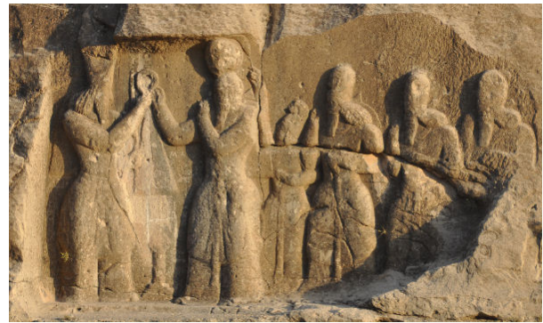
FIG. 14 : Relief d'investiture d'Ardāšīr I er à Firuzabad.

dérées plus haut. Dans l'iconographie développée ensuite, on retrouve la triple association investiture, victoire et marche de dressage. Sur les 19 reliefs dans lesquels le roi est figuré comme cavalier, se trouvent neuf occurrences de la marche dressage (voir le Table 1 ), trois occurrences de la posture d'arrêt 55 , et sept occurrences d'une posture de saut/galop volant. Les neuf occurrences de la marche de dressage sont presque à chaque fois associées à une représentation de la victoire 56 , qui est alors toujours associée à l'investiture 57 . Au contraire, les sept occurrences du saut/galop volant sont systématiquement associés à la chasse ou la joute équestre.