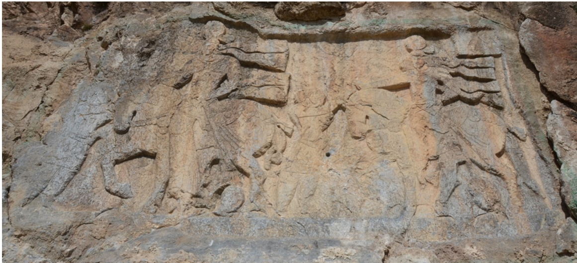
FIG. 3 : Relief de d'Ardāšīr I er à Salmas.