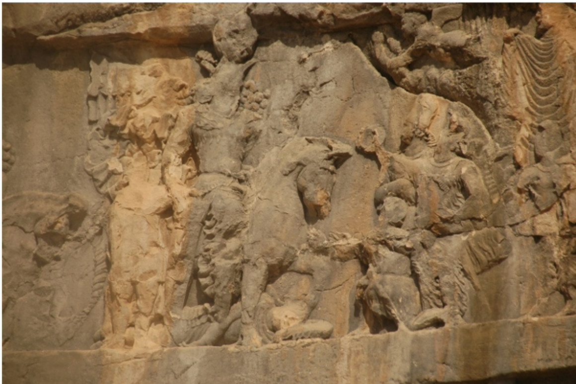
FIG. 8 : Détail du relief de Šāpūr I er (panneau central) à Bišāpūr (Bi III).