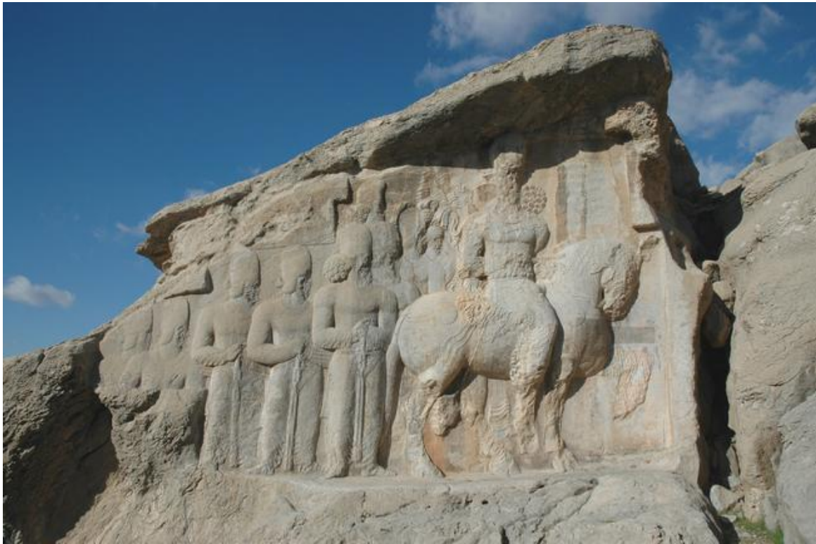
FIG. 5 : Relief de Šāpūr I er à Naqš-e Rājab (NRa IV), scène de cour (?).