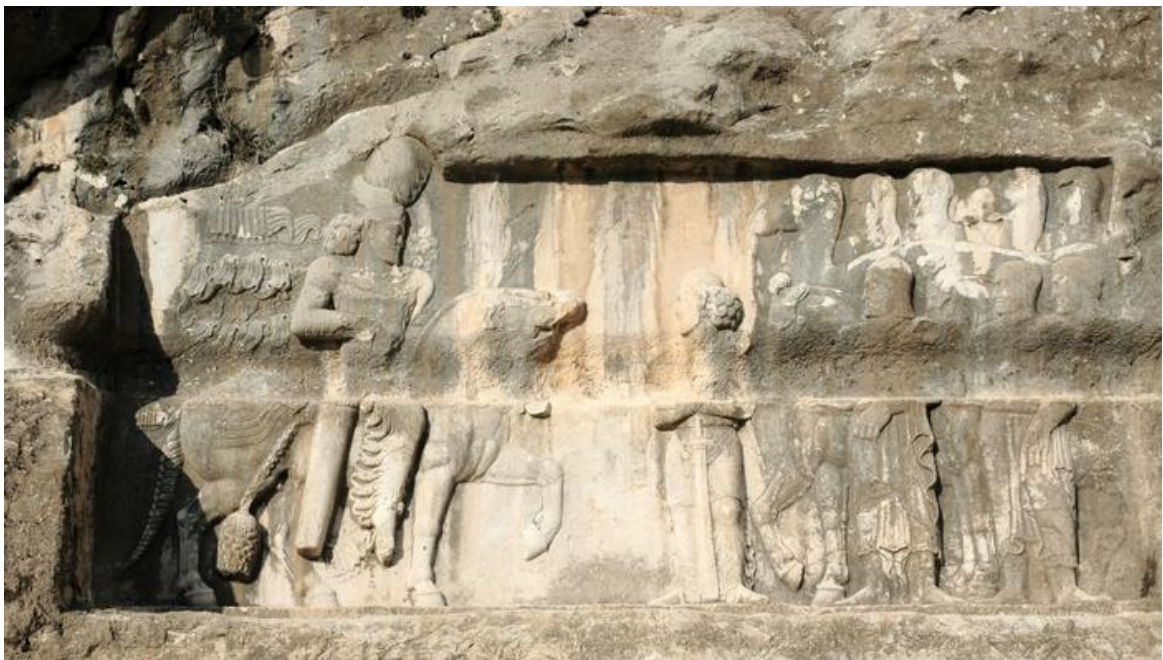
FIG. 10 : Relief de Wahrān II à Bišāpūr (Bi IV).