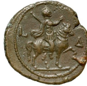
FIG. 13 : Monnaie de Philippe l'Arabe – marche de parade, encolure redressée avec prédominances des extenseurs du dos, tête naturelle, queue soulevée.

posture de dressage telle que développée depuis l'époque séleucide jusqu'à l'iconographie royale sassanide ne semble pas être attestée 46 .