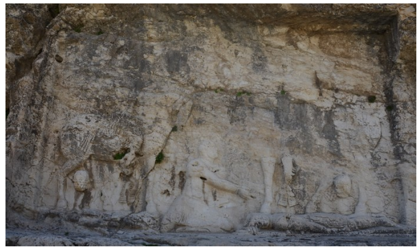
FIG. 1 : Relief de Šāpūr I er à Bišāpūr (Bi I).

pereur romain s'agenouille devant le roi des rois. Les reliefs de Bi I et de Darag ne figurant pas de marche de dressage, ils ne sont pas inclus dans la description technique ci-dessous. Cependant, ce choix nous paraissant tenir strictement de questions de composition, ils seront inclus dans le commentaire sur la place du cheval en marche dans l'expression de la royauté de Šāpūr I er .