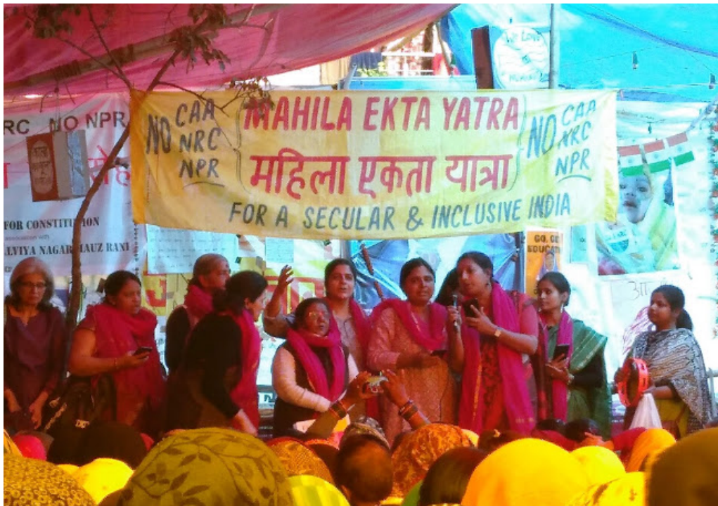
Figure 2 : Manifestation à New Delhi, février 2020