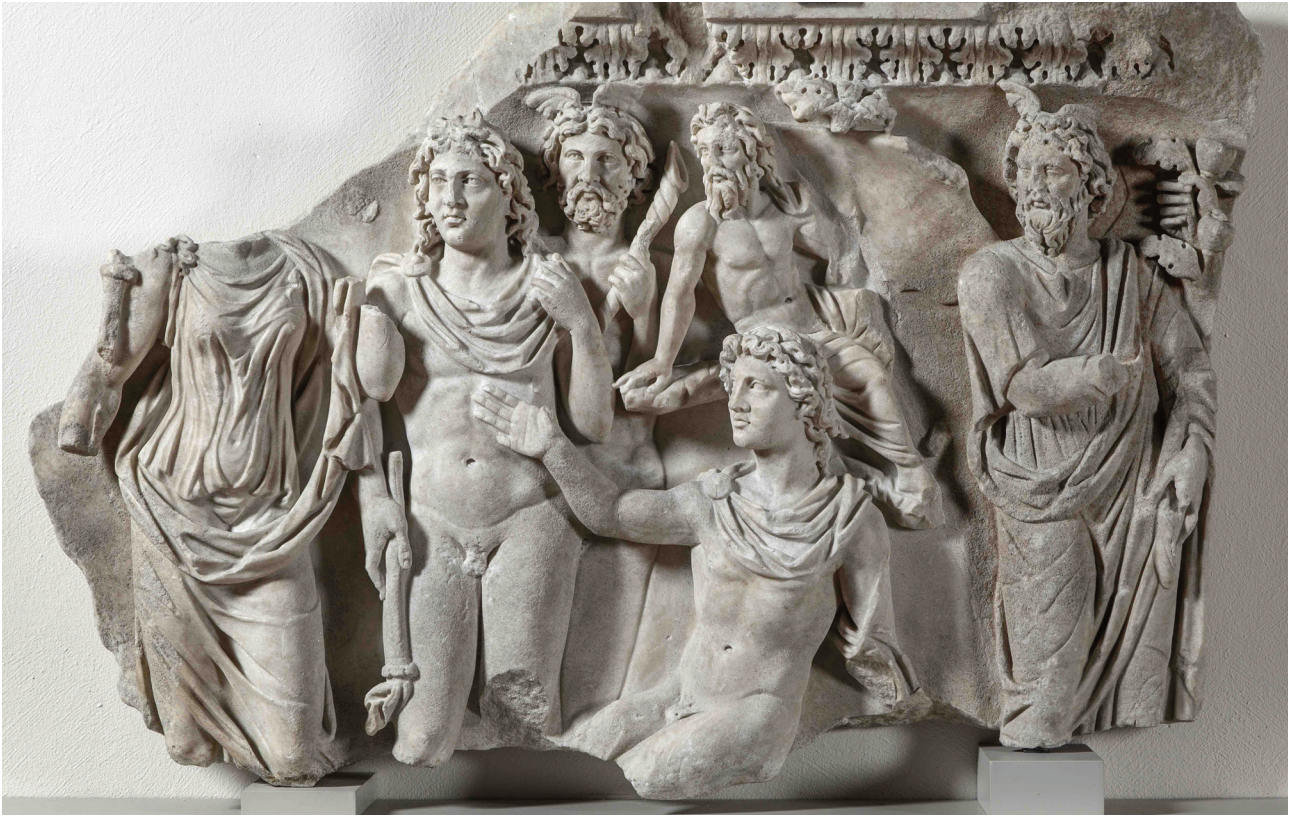
Fig. 10. Berlin, Staatliche Museen, Antikensammlung, Sk 846, vers 210-220 apr. J.-C. : fragment de sarcophage, Endymion éveillé tend la main vers Séléné, Hypnos se tient derrière lui.

Les exemples survolés dans ce bref exposé ont le mérite de délimiter plus précisément les rôles respectifs de l'analogie et de la typologie pour l'expression des identités dans le contexte funéraire de l'époque impériale. L'analogie, sous des formes diverses et complexes, est à la base du sémantisme des sarcophages mythologiques : en témoignent les choix des commanditaires, décelables à travers tous les aspects du sarcophage, de la sélection des thèmes et personnages à l'insertion éventuelle de portraits. Par ce mécanisme analogique, les bas-reliefs mythologiques s'acquittent de plusieurs fonctions : glorification des qualités et valeurs incarnées par le défunt, expression du chagrin de ses proches, consolation et espoirs eschatologiques. Il convient néanmoins de se garder de toute lecture