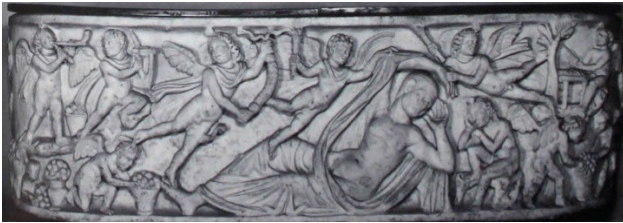
Fig. 4. Londres, British Museum, 1947.7-14.8, seconde moitié du III e s. dormeuse seule, sur le modèle d'Ariane découverte par Dionysos, retravaillée pour accueillir le portrait d'un homme.