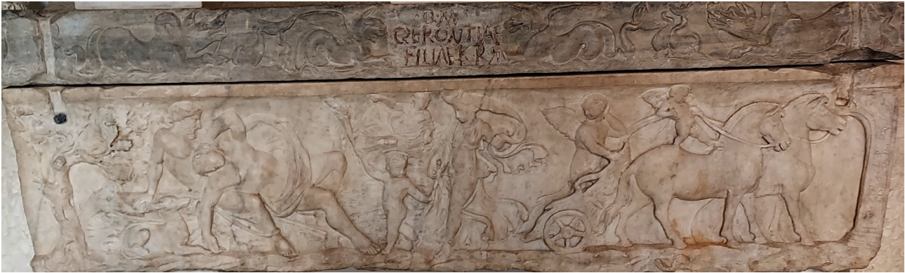
Fig. 2. Rome, Musei Capitolini, 11 e s. ap. J.-C. : sarcophage d'enfant, sommeil d'Endymion. Une inscription du 14 e s. indique une utilisation ultérieure par des parents pour leur fille, Gerontia.

dieu, surmonté toutefois du visage barbu d'un homme mûr. Quant aux figures les plus présentes sur les sarcophages, celles des jeunes gens disparus trop tôt, si elles traduisent certainement la notion de mort prématurée ( mors immatura ), on ne peut en revanche soutenir que toutes correspondent effectivement à des personnes décédées avant l'âge nubile [16]. Ainsi, la scène mythologique la plus répandue, celle du sommeil d'Endymion, a-t-elle pu être utilisée sur des sarcophages d'enfants, comme celui qui fut ultérieurement réutilisé pour une certaine Gerontia (fig. 2), ou de femmes cinquantenaires, comme Claudia Arria (fig. 3).