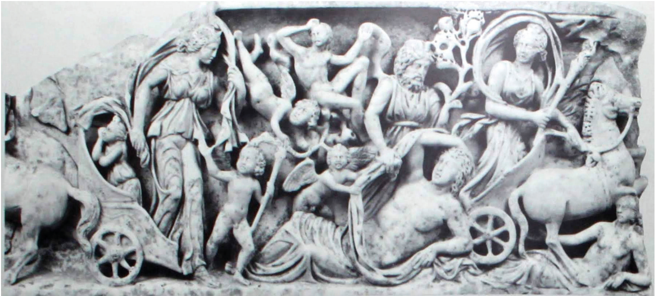
Fig. 5. Malibu, Getty Museum, 76.A.A.8, vers 220 apr. J.-C. : arrivée et départ de Séléné, Endymion au centre (Digital image courtesy of Getty's Open Content Program).

ceux de la déesse [22]. Le succès de ce topos s'explique à la fois par le caractère aisément reconnaissable de ses composantes [23] et par sa polyvalence sémantique : beauté idéalisée et pureté de l'amour éternel, euphémisme du sommeil comme métaphore de la mort, espoir d'immortalité, voire d'intimité avec les dieux, mais aussi tristesse de l'incommunicabilité symbolisée par les yeux clos. L'histoire de Séléné et d'Endymion semble avoir été avant tout un symbole d'amour transcendant les bornes de la mortalité : à ce titre, elle peut évoquer une union conjugale plus ou moins érotisée aussi bien que l'affection entre parents et enfants. Du reste, le point focal du tableau est moins le dormeur seul que sa relation avec la déesse, qui descend périodiquement lui rendre visite à l'instar du conjoint ou parent qui vient rendre hommage au mort, une torche à la main pour éclairer la tombe. Ce motif offre donc aux sculpteurs l'occasion d'une mise en abyme : à l'Endymion de chair et d'os amoureuxment contemplé par Séléné correspond l'Endymion de pierre admiré par les visiteurs de la tombe, qui lui-même se substitue au défunt d'autant mieux qu'il peut emprunter son visage.