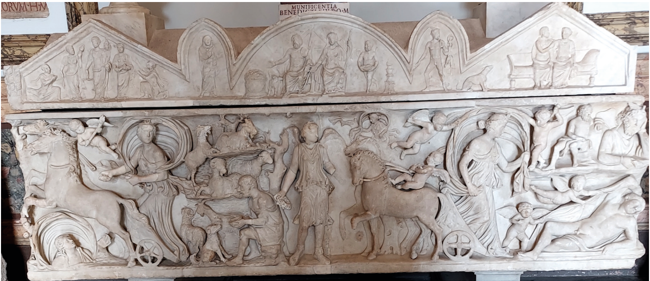
Fig. 6. Rome, Musei Capitolini, 725, vers 150-170 ap. J.-C. : départ et arrivée de Séléné, séparés par une scène pastorale.

permettant de faire porter l'emphase tantôt sur le désir érotique, tantôt sur les noces symboliques, tantôt sur la tristesse du tableau, tantôt encore sur son calme bucolique. L'une des principales altérations répertoriées du motif est le dédoublement de la scène, avec l'ajout du départ de Séléné, qui peut être représenté de trois manières différentes : sur un des petits côtés du sarcophage, ce qui en fait une scène complémentaire du tableau principal ; suivant un ordre de lecture de gauche à droite (fig. 5), avec la déesse rejoignant puis quittant Endymion, lequel occupe ainsi le centre d'une image symétrique qui joue à la fois sur l'idée de cyclicité et l'ellipse narrative ; enfin, avec l'apparition et la disparition de Séléné juxtaposées dos à dos (fig. 6), et le dormeur, relégué à l'extrémité droite, devenu un thème secondaire par rapport à la furtivité de la déesse qui repart comme elle est arrivée, avec un dernier regard vers l'objet de son désir.