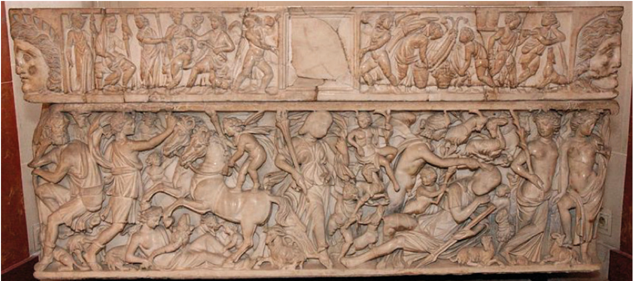
Fig. 7 et 8. Paris, Musée du Louvre, MA 1335, vers 230-240 ap. J.-C. : paire de sarcophages retrouvés à Saint-Médard-d'Eyrans, visite de Séléné à Endymion et découverte d'Ariane par Dionysos.