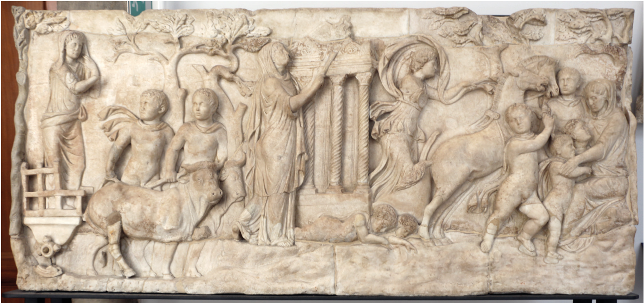
Fig. 1. Venise, Museo Archeologico Nazionale, vers 160 apr. J.-C. : stèle fermant la tombe de deux jeunes garçons, histoire de Cléobis et Biton incarnés par des putti.

Ce qui peut sembler mystérieux ou contradictoire à un observateur moderne constitue surtout un signe que la fonction des portraits d'époque ne saurait être réduite au seul mécanisme d'identification ou au renforcement de l'analogie [12]. Le portrait peut intervenir pour attirer l'attention sur un élément singulier de l'image ou pour en infléchir la lecture ; le recours à cette signature visuelle ne signifie donc pas une assimilation complète, directe et assumée avec le personnage qui la porte, et inversement, son absence n'enlève rien à la puissance du message analogique véhiculé par le mythe. De manière plus générale, il importe de distinguer entre l'analogie, indispensable à l'herméneutique des bas-reliefs mythologiques, et la simple identification qui peut s'avérer un écueil.