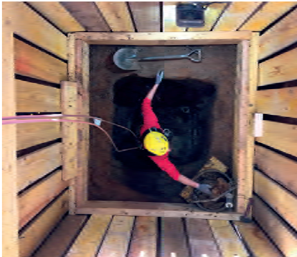
Figure 4 : exemple de mise en œuvre de boisage en contexte instable pour garantir la sécurité des parois lors de la fouille