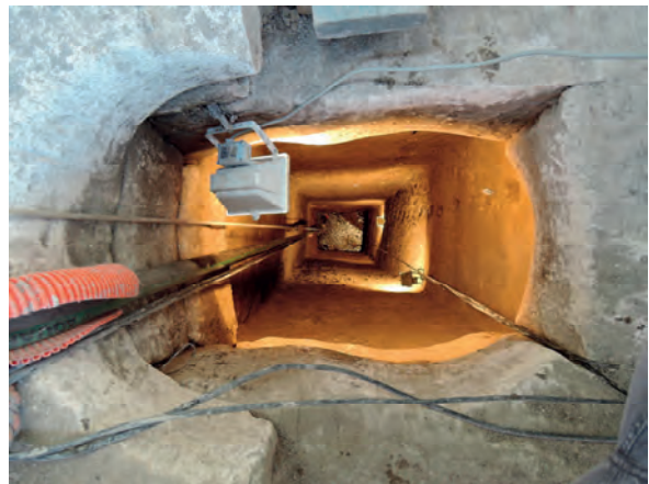
Figure 3 : vue depuis la surface d'un puits antique intégralement fouillé selon la méthode utilisée par l'équipe de la CISAP

L'aménagement des parois n'est pas systématique et dépend de la nature des matériaux encaissant. En surface, les chemisages en pierres sèches côtoient les maçonneries au mortier. Parfois des cuvelages en matériaux périssables sont préservés. Ces derniers se retrouvent en profondeur sous la forme de boisages assemblés à mi-bois destinés à soutenir les élévations (ou construction ?).