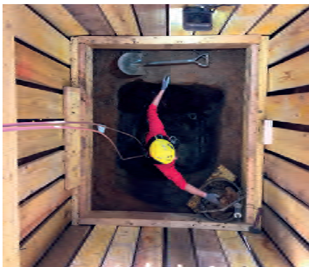
Figure 4 : exemple de mise en œuvre de boisage en contexte instable pour garantir la sécurité des parois lors de la fouille