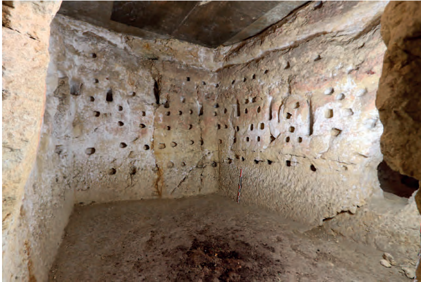
Figure 3 : Vue de la magnanerie et des alvéoles destinées à accueillir les vers à soie