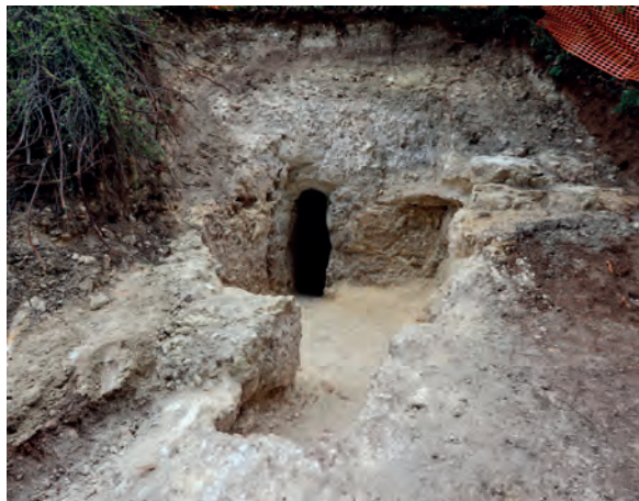
Figure 2 : Entrée et salle mises au jour dans le cadre du sondage C. À l'arrière-plan, le départ de galerie vers le souterrain

Face au pont-levis, le sondage D a permis d'identifier une autre salle connectée à une galerie, murée, se développant en direction de la tour quadrangulaire.