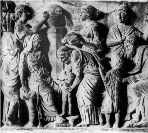
Fig. 12. Sarcophage en marbre. Florence, Galerie des Offices, Inv. 82. 180 ap. J.-C. D'après AMEDICK 1991, cat. 49, pl. 62, 2.

En dépit du fait qu'il soit de profil et avec les jambes fléchies, le nouveau-né du sarcophage de la Villa Doria Pamphilj (fig. 13) [16] est figuré dans une position presque analogue à celle de Florence : il pose ses mains sur les genoux de sa mère et la regarde. Cependant, cette dernière n'échange pas de regard avec son enfant, mais observe la femme qui s'en occupe. L'image du sarcophage de la collection Torlonia (fig. 2) est construite sur le même modèle : les jambes repliées, le bébé est sorti du bain par une femme. Il est tourné vers sa mère, pose sa main sur un de ses genoux mais semble cependant regarder la femme qui l'a baigné, alors que les deux femmes, elles, s'observent mutuellement. Sur le sarcophage du Louvre (fig. 1) l'enfant est représenté de profil ; les bras et les jambes balants, il regarde vers l'extérieur comme pour créer une relation avec le spectateur. L'exemplaire de Stuttgart (fig. 14) [17] montre l'enfant avec la jambe gauche tendue et posée dans la baignoire, et la jambe gauche fléchie. Il tend les bras à la femme de gauche.