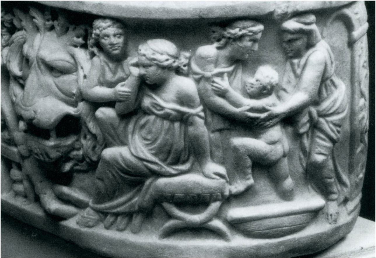
Fig. 14. Sarcophage en marbre. Stuttgart, Württembergisches Landesmuseum, Inv. Arch. 6318. Vers 220 ap. J.-C. D'après AMEDICK 1991, cat. 248, pl. 75, 2.

située à gauche ou au loin. Le dessin du sarcophage de Tivoli (fig. 6), la représente à genoux, à droite de la bassine, le corps baissé vers l'enfant qui lui fait dos et tend le bras gauche en direction de sa mère. Elle tient l'enfant avec la main droite sur son ventre et la main gauche, dans la bassine, certainement au niveau de ses cuisses. Sur le sarcophage de Poggio a Caiano (fig. 7), l'enfant face au spectateur lui tourne le dos et elle le tient de la main gauche. L'altération du relief a effacé son visage, et ne permet pas de savoir dans quelle direction elle regarde, ni ce qu'elle fait de la main droite. Toutefois, il est aisé d'imaginer un échange de regards entre le bébé et la femme, étant donné leurs attitudes. Sur le sarcophage de Los Angeles (fig. 5), la femme se tient agenouillée à gauche de la bassine et glisse son bras gauche autour de la taille de l'enfant et sa main droite sous ses fesses. Sa tête est baissée et elle regarde l'enfant. Sur le fragment de sarcophage découvert dans la Catacombe Prétexte (fig. 4), la femme est à genoux à gauche de la bassine, le corps penché au-dessus de l'enfant qu'elle tient allongé en partie au-dessus de l'eau. Sur le sarcophage du Musée Chiaramonti (fig. 8), la femme est agenouillée à droite de la bassine, le corps penché