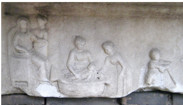
Fig. 3. Sarcophage à kliné de la Via Portuense. Rome, Musée national romain, Inv. n° 125605. Vers 100 ap. J.-C.

celui-ci est figuré allongé dans une baignoire, les jambes tendues, les bras le long du corps et la tête légèrement surélevée par la main de la femme qui le baigne en lui soutenant la nuque. Il se trouve alors face à sa mère et tous deux semblent se regarder alors que les deux femmes qui s'en occupent lui donnent toute leur attention.