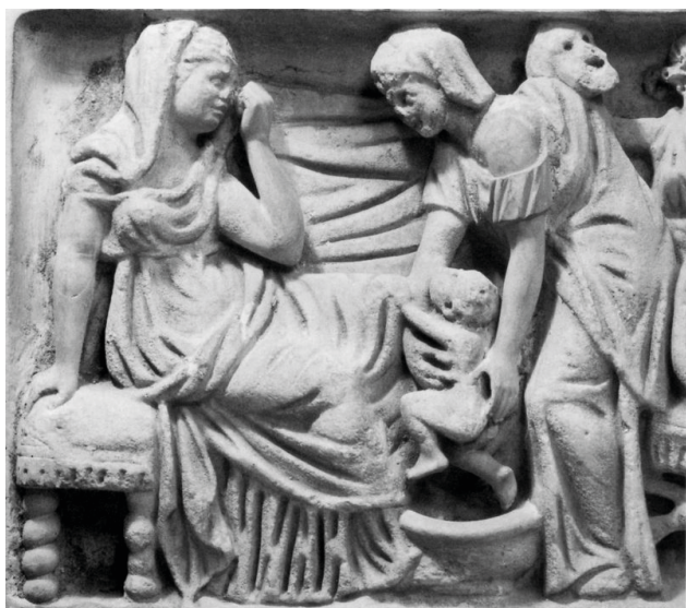
Fig. 2. Sarcophage en marbre de la Via Portuense. Rome, Musée Torlonia, Inv. n° 414. Vers 200 ap. J.-C. D'après AMEDICK 1991, cat. 198, pl. 54,1.

La scène de bain peut être beaucoup plus schématique et représenter un nombre plus restreint de personnages. C'est notamment le cas pour la scène du sarcophage conservé au Musée Torlonia (fig. 2) [4] qui en compte trois : à gauche se trouve une femme assise sur un tabouret, les jambes légèrement écartées. Elle est appuyée sur son bras droit et porte sa main gauche au visage. Elle regarde la femme face à elle et les traits de son visage semblent indiquer qu'elle est en train de pleurer, confirmant la symbolique du geste de la main. Elle porte une stola et une palla dont un pan voile la tête. Face à elle, l'autre femme, est vêtue d'une tunique et a la tête couverte d'un voile court. Elle soulève le nouveau-né d'une bassine posée au sol. Elle est debout, le dos recourbé et les jambes légèrement fléchies. Elle regarde la femme assise. Le nourrisson lève la tête vers elle, il a les jambes repliées et la main gauche posée sur le genou gauche de sa mère. La position de ses jambes laisse supposer qu'il gesticule. Aucun autre personnage n'est représenté dans cette image du bain, ce qui laisse supposer que la simple présence de ces trois individus devait suffire à identifier la scène pour les spectateurs antiques.