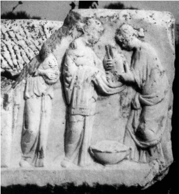
Fig. 10. Fragment sarcophage en marbre. Ostie, Scavi, Inv. 1170. Milieu de l'époque antonine. D'après AMEDICK 1991, cat. 107, pl. 57, 3.

Cette relation avec la femme qui le soulève s'observe également sur le relief d'Ostie (fig. 10) [13] qui bien qu'altéré le représente dos au spectateur, et se retrouve aussi sur le couvercle du sarcophage exposé au Musée national romain (fig. 11) [14]. En effet, bien que la bassine soit manquante, la mise en série des images et les différents personnages composant la scène permettent de reconnaître une scène de bain. Le nouveau-né est représenté de dos, tendant les bras vers la femme qui le porte, la jambe gauche tendue et la droite pliée. Si la mère le regarde, lui ne jette aucun coup d'œil vers elle.