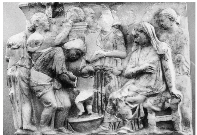
Fig. 9. Sarcophage en marbre. Agrigente, Musée national, 120-130 ap. J.-C. D'après AMEDICK 1991, cat 2, pl. 53,3.

Les autres images le montrent en train d'être sorti de son bain. Sur le sarcophage d'Agrigente (fig. 9) [12], il tend les bras vers la femme qui le soulève de la bassine. Il est représenté de dos, les jambes légèrement pliées. Sur cette image, seule la relation avec la femme qui le baigne est mise en avant puisque le nouveau-né fait dos à sa mère et n'interagit donc pas avec elle. Cette dernière le regarde, la tête baissée.