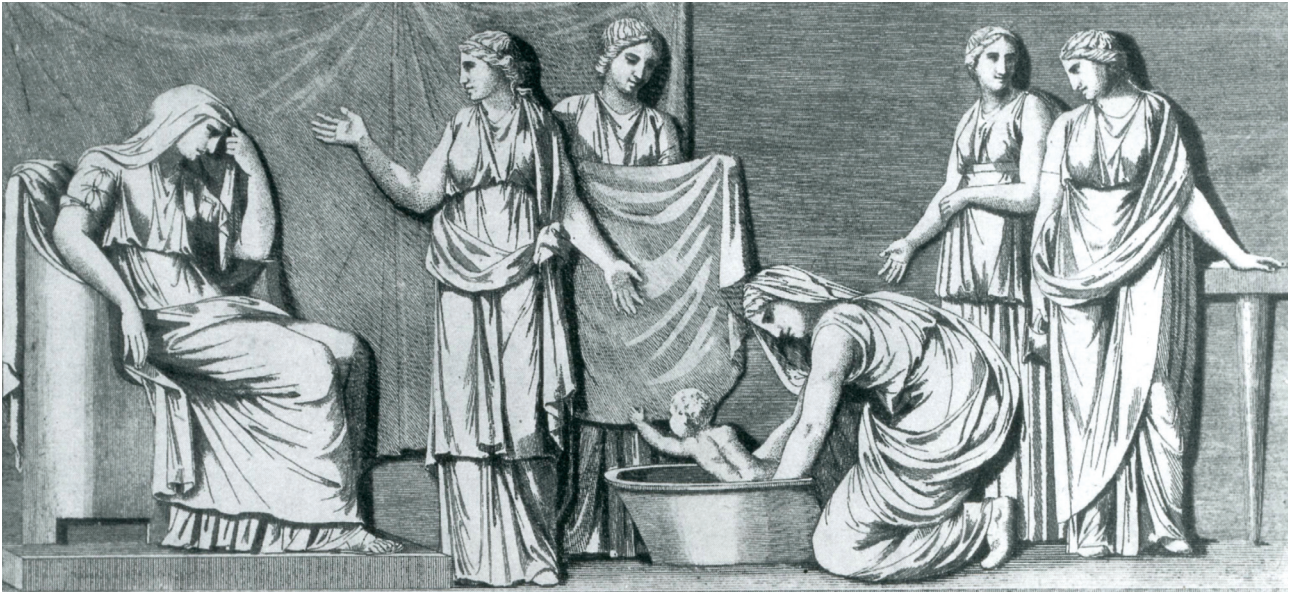
Fig. 6. Dessin de sarcophage, Tivoli. D'après AMEDICK 1991, cat. 250, pl. 62,6.