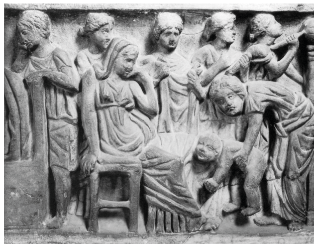
Fig. 1. Sarcophage en marbre. Paris, Musée du Louvre, Inv. MA319. 1er quart du III e s. ap. J.-C.

l'extérieur du relief. Face à la scène du bain, sur la gauche, une femme vêtue d'une tunique longue et d'un voile sur la tête est assise sur un tabouret. Elle est appuyée sur sa main droite et porte sa main gauche au visage. Elle a les jambes écartées en direction de l'enfant. Juste derrière elle, se tient une femme coiffée d'un chignon, qui regarde en direction du globe posé sur un pilier à l'extrême gauche de la scène. Entre la femme qui soulève l'enfant et la femme assise se tient une autre femme, debout, avec une serviette dépliée dans les mains. En arrière-plan, à droite sont représentées deux femmes coiffées d'un chignon. Celle de droite porte un objet dans la main droite et observe un globe, et l'autre tient une tablette dans la main gauche.