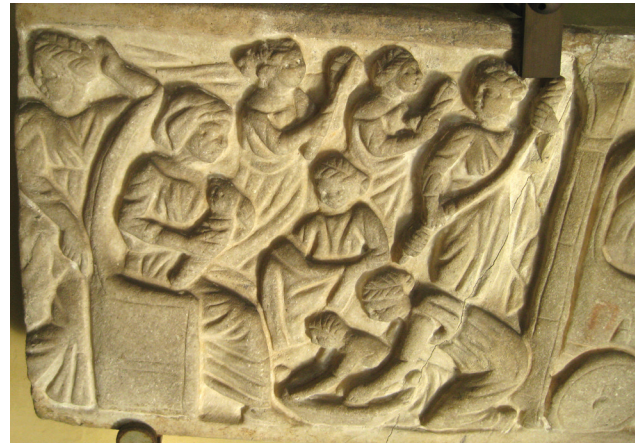
Fig. 8. Fragment de sarcophage en marbre. Vatican, Musée Chiaramonti, Inv. 1632. Fin du III e s. ap. J.-C.

Les autres images le montrent en train d'être sorti de son bain. Sur le sarcophage d'Agrigente (fig. 9) [12], il tend les bras vers la femme qui le soulève de la bassine. Il est représenté de dos, les jambes légèrement pliées. Sur cette image, seule la relation avec la femme qui le baigne est mise en avant puisque le nouveau-né fait dos à sa mère et n'interagit donc pas avec elle. Cette dernière le regarde, la tête baissée.