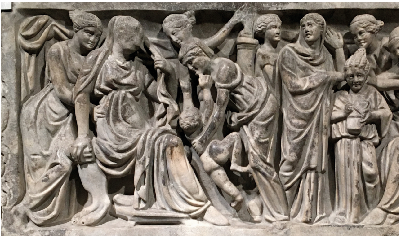
Fig. 11. Couvercle de sarcophage en marbre. Rome, Musée national romain, Inv. n° 112327. 190-200 ap. J.-C.

Toutefois d'autres images illustrant la sortie du bain mettent au contraire en avant la relation entre la mère et l'enfant. Le nourrisson porté hors du bain sur le sarcophage de Florence (fig. 12) [15] est figuré de dos, les jambes tendues et le bras gauche posé sur la cuisse de sa mère. Il bascule la tête en arrière et regarde vers le haut ; la mère comme la femme qui le baigne le regardent.