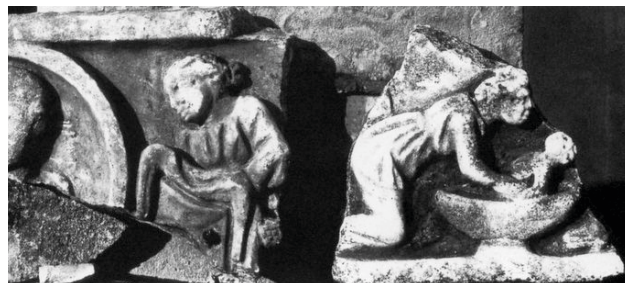
Fig. 4. Fragment de sarcophage en marbre. Rome, Catacombe Prétexte, Musée, Inv. 315. Fin du III e s. ap. J.-C. D'après AMEDICK 1991, cat. 142, pl. 61,8.

du sarcophage du musée Chiaramonti (fig. 8) [11] : à genoux, il tourne le dos à la femme qui semble être en train de lui frotter les cuisses.