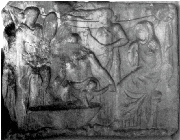
Fig. 7. Sarcophage en marbre. Poggio a Caiano, Villa Midecea. 160-170 ap. J.-C. D'après AMEDICK 1991, cat. 123, pl. 62,3.