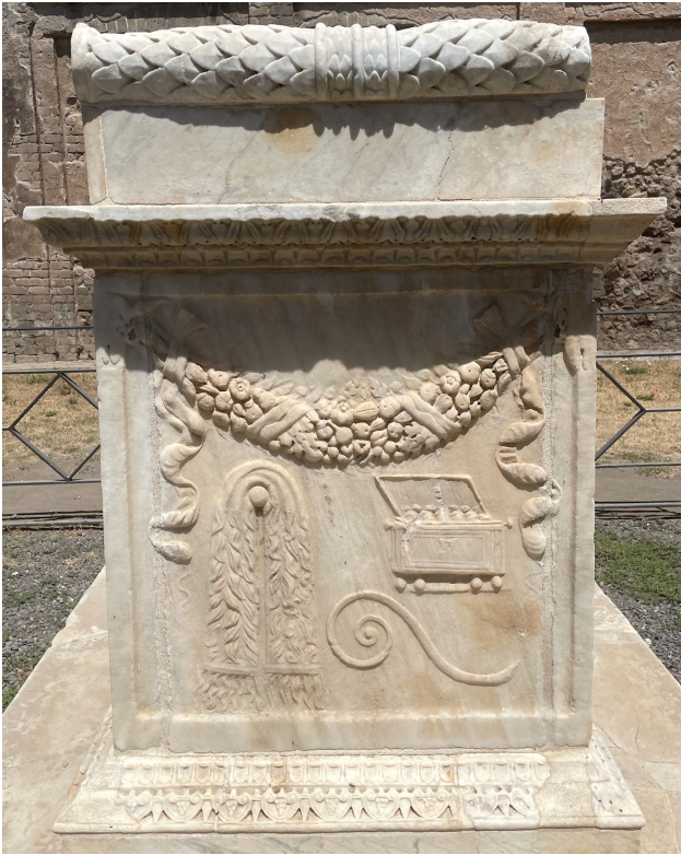
Fig. 8, 2. Autel du temple dit « de Vespasien », forum de Pompéi.

élevés, les salaires ne le sont pas non plus : un ouvrier gagnait 8 à 16 as par jour et ne pouvait donc guère se payer le luxe d'acheter régulièrement de l'encens et encore moins de l'encens de qualité supérieure. Properce lui-même évoque cet encens à bas prix [52], ce qui pourrait laisser supposer que ce type d'encens n'était pas hors de portée de la bourse des plus modestes.