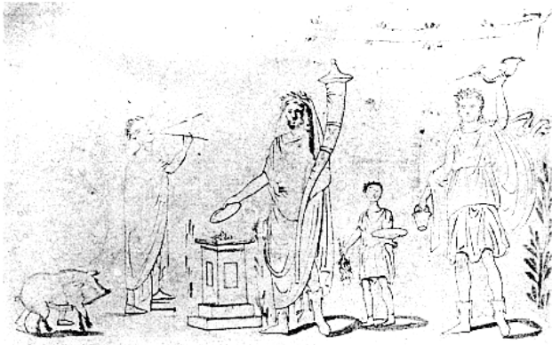
Fig. 6. Peinture de laraire, VII, 12, 10, Pompéi. D'après FRÖHLICH 1991, pl. 44,2, L 90.

Nous savons que certains de ces objets pouvaient être en métal précieux comme le rapporte Cicéron [33] :