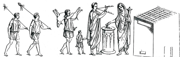
Fig. 7. Peinture de laraire, VII, 4, 20, Pompéi. D'après Boyce 1937, n° 271, pl. 18,2.

Sur d'autres, en revanche, nous trouvons près de l'autel le popa [39], avec couteau sacrificiel ou maillet, accompagné du porc, mais la mise à mort n'est pas illustrée