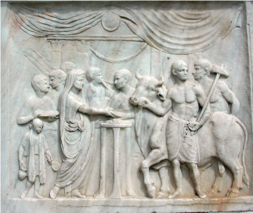
Fig. 8, 1. Autel du temple dit « de Vespasien », forum de Pompéi.

En dehors de la prière du matin [41], un sacrifice était offert durant les banquets entre les deux services [42], consistant en une libation d'encens et de vin aux Lares domestiques et au Genius du pater familias . Ce dernier était célébré chaque année le jour anniversaire de la naissance [43] par la personne concernée [44] ainsi que par les membres de sa famille [45] et ses amis [46] qui apportaient en don des couronnes de fleurs, des cadeaux [47]. Le Genius de l'homme et la Iuno de la femme recevaient des offrandes de remerciements [48] alors que brûlait l'encens [49] sur un autel enflammé.