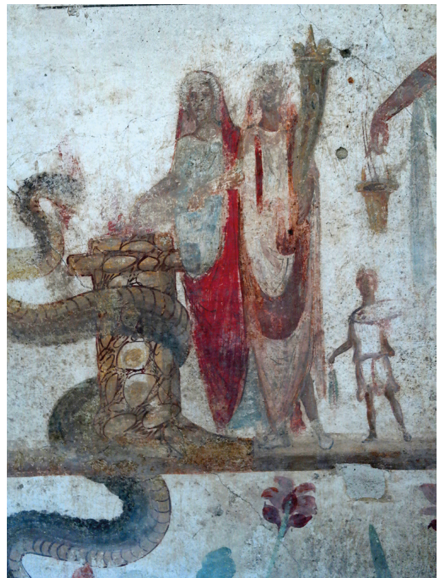
Fig. 3. Peinture de laraire, Casa di Julio Polibio, Pompéi.

Sur le laraire de la Casa dei Vettii (fig. 2), le peintre n'a pas représenté l'autel, mettant l'accent sur le sacrifiant : or l'autel est indispensable à l'accomplissement des rites quotidiens [23]. Selon Varron, il n'était pas permis d'offrir des sacrifices publics ou privés sans foyer [24]. Le focus est en fait un foculus , foyer portatif circulaire, placé auprès de l'autel quadrangulaire, sur lequel sont faites des libations préliminaires de vin et d'encens, et essentiel au sacrifice [25]. Dans certains cas, le pater familias avait recours à l' arula , mot qui désigne une catégorie de petits autels portatifs [26], le plus souvent en terre cuite, plus rarement en pierre ou en marbre [27]. Ceux-ci sont attestés dans plusieurs maisons pompéiennes et sont un précieux témoignage