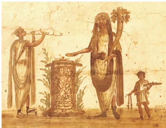
Fig. 1. Peinture du Genius . MANN inv. 8905.

en absolument aucun lieu ni aucune ville. Que nul ne vénère, sacrilège plus discret, son dieu Lare par le feu, un Génie par du vin pur, les Pénates par du parfum, ni n'allume des lampes, ne dépose de l'encens ou ne suspende de guirlandes » [4].