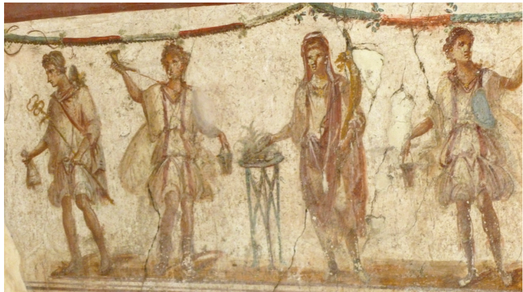
Fig. 5. Peinture de laraire, caupona I, 10, 8, Pompéi.

Si la présence d'encensoirs est attestée, comme dans la maison III, 4, 2-3 [32], aucune acerra n'a été retrouvée, à ma connaissance. Certes, le matériau devait être fragile, notamment en ivoire ou en bois, mais certains éléments de mobilier ont été conservés à Pompéi et surtout à Herculaneum où ont été mis au jour des laraires en bois. Faut-il en déduire que les acerrae n'étaient pas aussi répandues que nous le pensions et que le faible nombre de représentations figurées correspond à la réalité quant à son utilisation ?