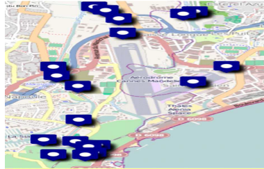
FIG. 3 – Composante VGI

serveur SOLAP est basé sur GeoMondrian 8 , qui est un serveur multi-fonctions définissant les concepts spatio-multidimensionnels et un mapping du fichier XML avec un schéma relationnel. Les mesures et agrégations décrites dans la section 3 sont définies avec le langage MDX (MultiDimensional eXpressions Language), un standard de requêtes et un langage de calcul pour les systèmes OLAP. Les affichages tabulaires et cartographiques des requêtes SOLAP sont fournis par le système SOLAP Map4Decision 9 . Nous supposons que les données VGI peuvent être fournies par un outil geowiki tel que Wikimapia et/ou utilisant un système ad-hoc de crowdsourcing (Figure 3).