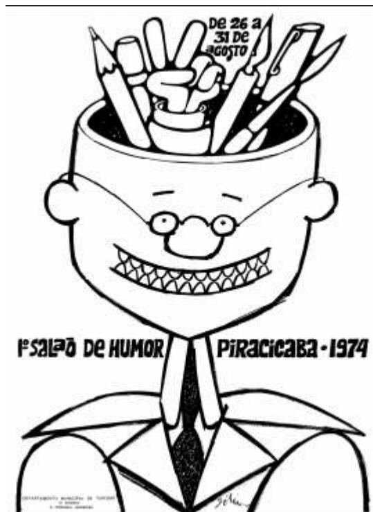
Figure n° 2 : Affiche de la première édition du Salon de l'humour de Piracicaba

Archives du CEDHU, Piracicaba, Zélio Alves Pinto, Affiche du 1 er Salon de l'humour de Piracicaba, 1974