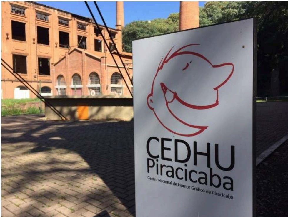
Figure n° 1 : Photographie du CEDHU