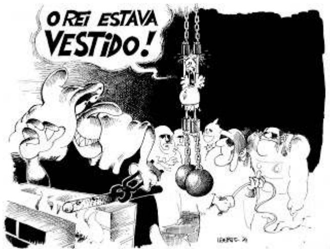
Archives du CEDHU, Piracicaba, fonds « 1974 », Laerte Coutinho, 1 er prix du Salon de l'humour de Piracicaba