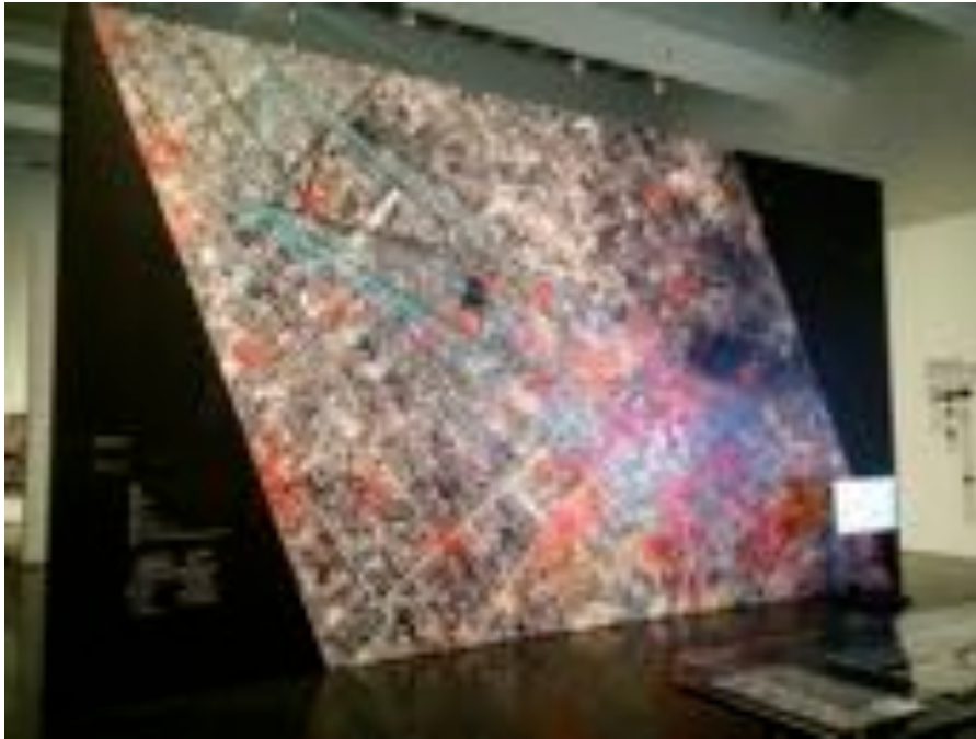
FIGURE 4 – Forensic Architecture, Rafah, vendredi noir 1er août 2014. Vue de l'expo du MACBA, Barcelone, été 2017. 8

entier (voir Fig. 4). Récemment, le collectif a fait parler de lui suite à la reconstitution de la scène de la supposée « mort accidentelle » de Zineb Redouane après un tir de grenade lacrymogène lors de la troisième mobilisation des Gilets jaunes à Marseille le 1er décembre 2018 6 .