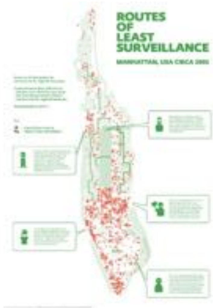
FIGURE 6 – Institute for Applied Autonomy, Routes of Least Surveillance, Manhattan, USA, CIRCA 2001. Carte reproduite dans An Atlas of Radical Cartography (2008).

On le sait, les technologies de surveillance ont beaucoup gagné en sophistication pendant ces dernières années, jusqu'à l'ultime invention de la reconnaissance faciale dont certaines start-up zélées sont déjà en train d'exploiter les algorithmes qui nous renvoient aux pires heures de la classification physiognomonique. Selon Giorgio Agamben (2014, 48-49), aux yeux de l'autorité