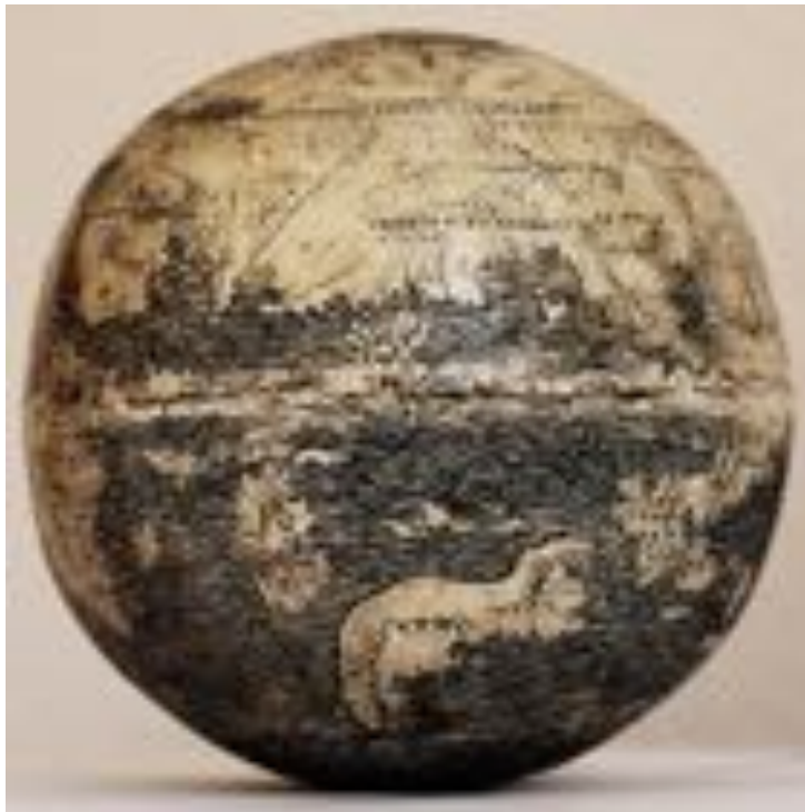
FIGURE 2 – Globe terrestre, 1504, Florence. Gravure et peinture sur deux moitiés inférieures d'œuf d'autruche, collection particulière.

Mais cette vision portée sur les cartes de cette époque est anachronique, trop influencée par la cartographie subjective du XX e siècle ; les conquérants de la Renaissance, eux, voulaient des cartes précises, des outils de la colonisation et pour cela, il fallût que les mathématiciens inventent les projections cartographiques dont la première fut celle de Mercator qui, en 1569, posait, sans le savoir, les premiers jalons de l'image composite cartographique.