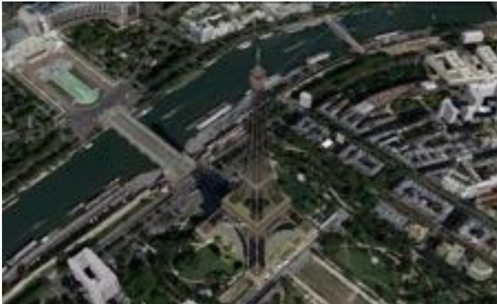
FIGURE 3 – Capture d'écran montrant une vue Google Earth de la Tour Eiffel avec l'option « Bâtiment 3D » cochée.

en mosaïque mais suivant l'exemple, canonique, de la première bille bleue. Ainsi, lorsque Google a mis à disposition du grand public en 2005 son programme de vision satellitaire Google Earth et que c'est à ce même moment qu'a commencé à se démocratiser dans nos usages quotidiens le GPS, donc la géolocalisation, nous étions déjà préparés par des années d'imagerie cartographique à accueillir cette révolution des représentations de la terre, sans comprendre qu'il n'y aurait pas de retour en arrière dans notre manière de nous figurer le monde. Le rapport inversé, évoqué plus haut, dans la représentation que l'on se fait des différences entre dessin et photographie a fini par être totalement annulé par les actuelles vues par satellite de Google Earth. En effet, le dessin, en dehors de la carte, agit également par-dessus l'image à travers les reconstitutions tridimensionnelles (fabriquées initialement grâce au logiciel Sketchup) des bâtiments et reliefs aujourd'hui créées par des algorithmes à partir, entre autres, d'images Google Street View (voir Fig. 3).