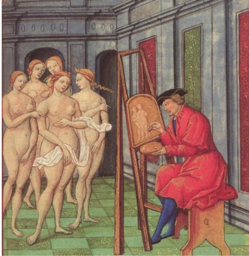
FIGURE 1 – Zeuxis peignant les filles de Crotona, Enluminure tirée du manuscrit du Roman de la rose, 1525. New York, The Pierpont Morgan Library.

On connaît le commentaire d'Alberti dans De Pictura (2019) qui fait de cette histoire un exemple du bon jugement de l'artiste ne se fiant ni à son imagination ni à la simple représentation de la nature jugée trop imparfaite. L'image idéale de beauté se situe ainsi au-delà de l'imitation de la nature et même au-delà d'une image idéale puisqu'elle ne trouve pas non plus de source dans la seule inspiration de l'artiste. La peinture apparaît donc comme une opération mentale, fondée sur la capacité de choisir et de recomposer. Elle place le peintre dans une situation interlope entre capacité à analyser la réalité et capacité d'invention par l'imagination, quelque part, dit Alberti,