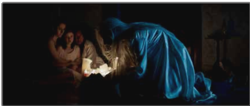
Figura 6 Exorcismo de los vivos