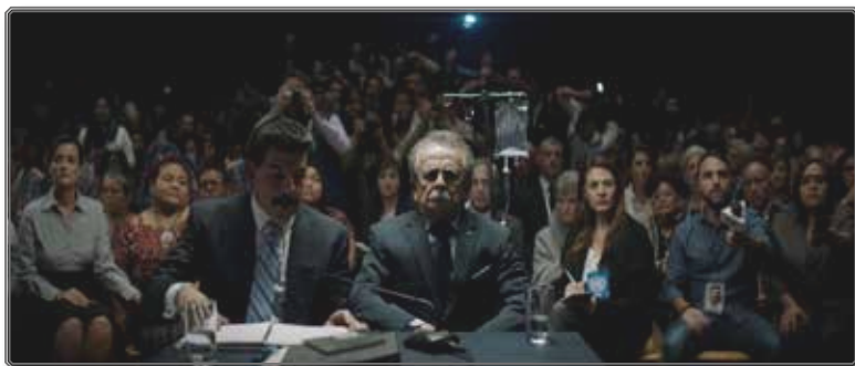
Figura 4 Cuerpos del tribunal y justicia inconclusa

encargan también de reclamar que se haga justicia, funcionando entonces como los dobles de otros cuerpos, los de los asistentes al juicio, que han sido testigos del fracaso de la justicia de los vivos [figuras 4 y 5]. El desaparecido, convertido por el género en una criatura espectral, invadiendo el espacio sonoro del interior de la casa con su murmullo, clama la necesidad de su venganza.