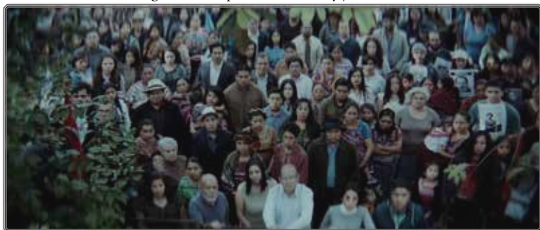
Figura 5 Cuerpo de los desaparecidos y justicia espectral

Sin embargo, a pesar de su corporeidad, no va a ser la Llorona quien se encargue de ejecutarla, como en la película de René Cardona, sino que va a proceder a la infiltración del núcleo familiar del general, desde dentro, despertando los rencores, haciendo que emerjan las miserias familiares enterradas en el olvido y el silencio. En el seno de la familia, va a poner en marcha un mecanismo de actualización del pasado y de activación de la memoria, como contrapunto del que ha tenido lugar, entre los muros del tribunal, durante el juicio. La carga política va a desplazarse y a resolverse en el seno de la familia, materializando la justicia espectral, y esta crisis familiar va a ser mucho más mortífera que los fenómenos paranormales que la rodean.