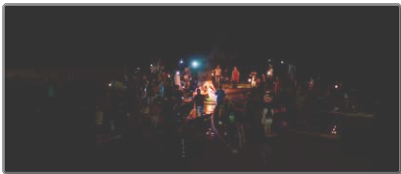
Figura 8 Exorcismo de reconciliación