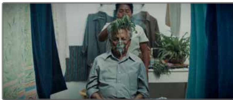
Figura 3 Ceremonia maya de purificación

Sin embargo, la presencia de la Llorona no es percibida del mismo modo por unos y otros. Para los empleados mayas de la casa, la hipótesis de la presencia de este ser sobrenatural es inmediatamente entendida y aceptada, orientando entonces la lectura de la película hacia el realismo mágico y su integración casi etnológica de lo extraordinario, en la que lo sobrenatural forma parte de la concepción del mundo y de la realidad propia de los personajes 19 . Para la familia del general, los primeros fenómenos se atribuyen a la senilidad del anciano, sin que la hipótesis sobrenatural se tenga realmente en cuenta, por lo menos al principio, sugiriendo una indeterminación para el espectador sobre el origen del acontecimiento sobrenatural, característica propiamente fantástica 20 . El filme autoriza incluso la cohabitación de las dos hipótesis, cuando el general, al descubrir una mancha de humedad (otro motivo acuático que remite a la Llorona) en la pared de su cuarto, considera que es la causante de los males que le aquejan. Entonces adopta dos medidas, una racional y otra irracional: la mancha debe ser lavada, como una medida higienista que podría acabar con su enfermedad, pero también acepta la proposición de Valeriana, la sirvienta maya, para proceder a una ceremonia mágica de purificación [figura 3].