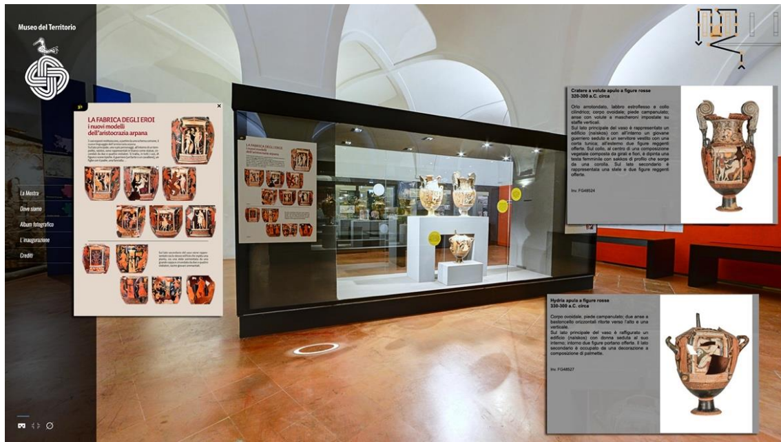
Figura 3. Il VT della mostra “Una storia spezzata. Guerrieri ed eroi ad Arpi”; esempi di schede informative.