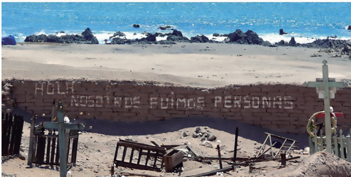
Arriba, la península de Cobija en la actualidad. Abajo, un muro del cementerio con un conmovedor mensaje para persuadir y detener a los profanadores.