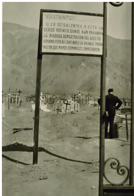
Letrero instalado en el cementerio de Cobija.

Fue entonces que la zona cobijeña comenzó a coleccionar una importante cantidad de agujeros que daban las pistas de las incesantes exploraciones. Por su parte, el cementerio seguía atestiguando la profanación. Un segundo letrero instalado en la necrópolis imploraba: “Visitante: si lo deseas entra a este sagrado recinto donde aún perdura la piadosa demostración del afecto humano pero no continúes la salvaje profanación que manos criminales empezaron”. Al poco tiempo de colocado, el letrero también fue demolido por los mismos a quienes interpelaba.