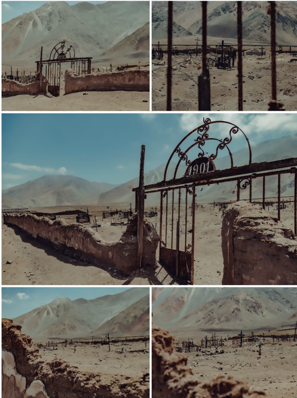
Cementerio de Cobija en 2019, donde se aprecian las profanadas tumbas y los muros erosionados por la acción ambiental y humana. La fecha del portal remite a la época de la instalación de aquella puerta por la municipalidad de Cobija, institución creada en 1894.

de la comida depositada como ofrenda en los primeros ataúdes se transitó hacia las flores de papel que, carbonizadas por los rayos solares y destruidas por la brisa marina, demandaron la fabricación de flores de hojalatería como ofrenda. Fue de ese modo que se apostó también por el reciclaje de las calaminas, los tarros de leche y las latas de jurel y de atún.