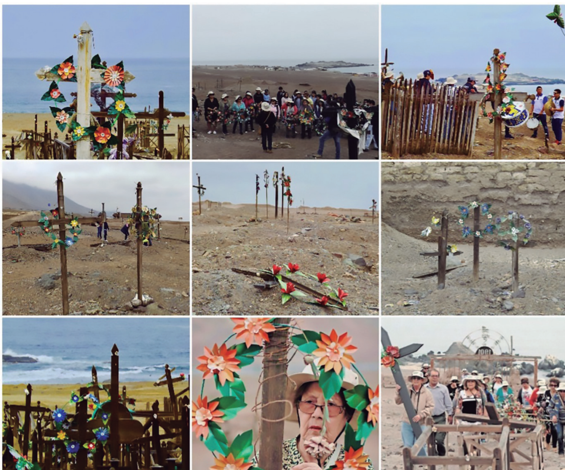
Romería de mujeres y de jóvenes en el cementerio de Cobija para instalar coronas de flores de hojalata, una forma de resarcimiento y de reparación frente al histórico daño causado en aquel cementerio patrimonial. Fotografías del archivo personal de Damir Galaz-Mandakovic (noviembre de 2017).

Más allá de aquellas consideraciones, cabe indicar que, ante la escena de dismantelamientos y ante la ineficacia de la protección que deben brindan los agentes territoriales del Estado, desde hace menos de una década, año tras año, en la antesala del Día de Todos los Santos, un grupo de mujeres de Tocopilla marcha ceremoniosamente en romería al compás de cumbias y de caporales que interpreta una banda musical camino hacia el cementerio de Cobija. La sonoridad y la armonía de la banda musical acompañan la práctica de un nuevo y singular ritual religioso y popular que se transformó, hace muy pocos años, en tradición en el desierto costero con trabada poética de la muerte.