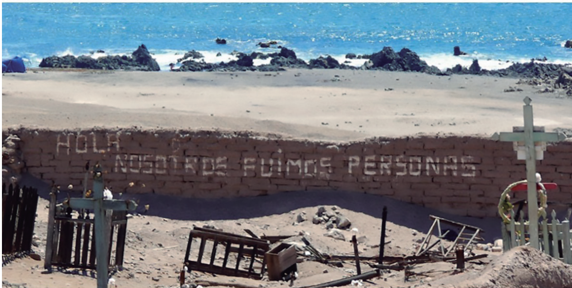
Arriba, la península de Cobija en la actualidad. Abajo, un muro del cementerio con un conmovedor mensaje para persuadir y detener a los profanadores.