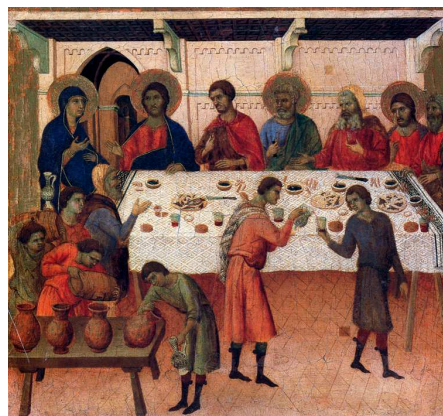
Fig. 16 – Duccio di Buoninsegna, Maestà , détail avec Les Noces de Cana (cl. : Giovanni dall'Orto).