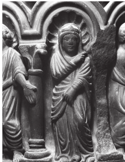
Fig. 9 – Noces de Cana, colonne B du ciborium de l'autel majeur, Venise, Basilique de San Marco, détail de l'épouse (cl. : Böhm, Fondazione Giorgio Cini, Fototeca Istituto di Storia dell'Arte).