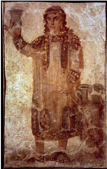
Fig. 1 – Serviteur provenant d'un palais sur la colline du Celia à Rome (cl. Musée national d'archéologie de Naples).

serviteur, s'autoproclame « ministre de la boisson » ( archonta tês póseōs 213e). Plutarque dans les Questions conviviales (I, 4) lui consacre tout un traité moral, « Quelles qualités doit avoir le symposiarque », dont on déduit également qu'il s'agit d'un personnage élu parmi les convives. La confirmation du caractère libre de cette figure apparaît cependant clairement dans Apophthegmata Laconica (208B), un ouvrage dans lequel Plutarque distingue le symposiarque de l'échanson principal ( oinochóos ), qui est au contraire un serviteur.