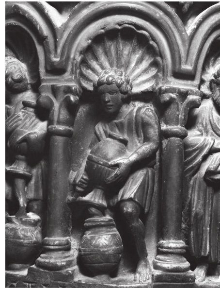
Fig. 5 – Noces de Cana, colonne B du ciborium de l'autel majeur, Venise, Basilique de San Marco, détail d'un serviteur.