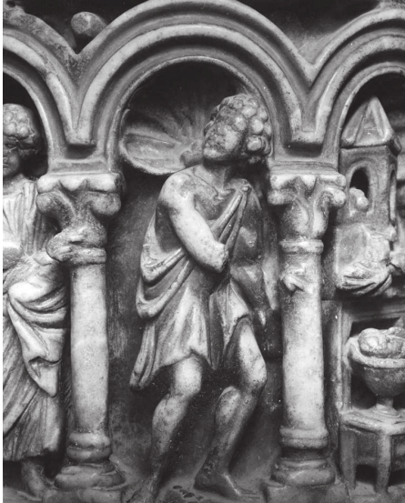
Fig. 2 – Noces de Cana, colonne B du ciborium de l'autel majeur, Venise, Basilique de San Marco, détail du messager (cl. : Böhm, Venezia, Fondazione Giorgio Cini, Fototeca Istituto di Storia dell'Arte).