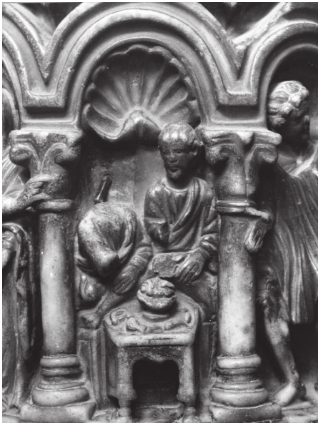
Fig. 4 – Noces de Cana, colonne B du ciborium de l'autel majeur, Venise, Basilique de San Marco, détail du banquet.