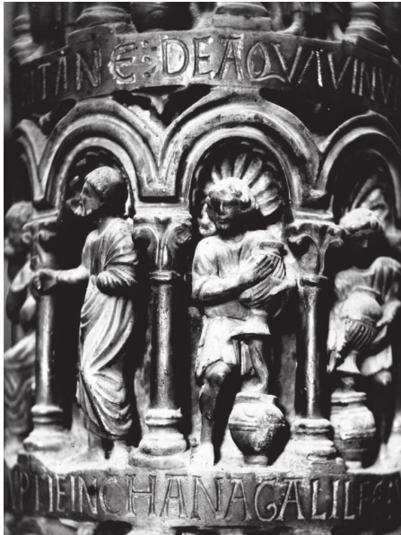
Fig. 6 – Noces de Cana, colonne B du ciborium de l'autel majeur, Venise, Basilique de San Marco, détail d'un serviteur (cl. : Böhm, Fondazione Giorgio Cini, Fototeca Istituto di Storia dell'Arte).