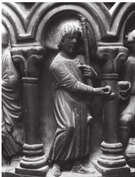
Fig. 10 – Noces de Cana, colonne B du ciborium de l'autel majeur, Venise, Basilique de San Marco, détail de l'architrave