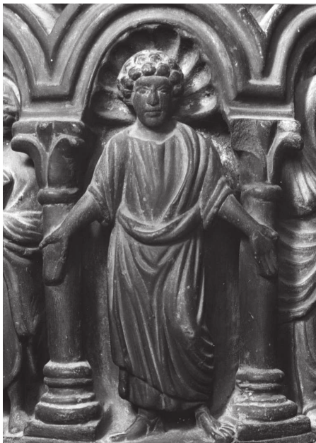
Fig. 8 – Noces de Cana, colonne B du ciborium de l'autel majeur, Venise, Basilique de San Marco, détail du Christ.