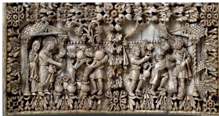
Fig. 20 – Plaquette d'ivoire avec scènes de la vie du Christ.