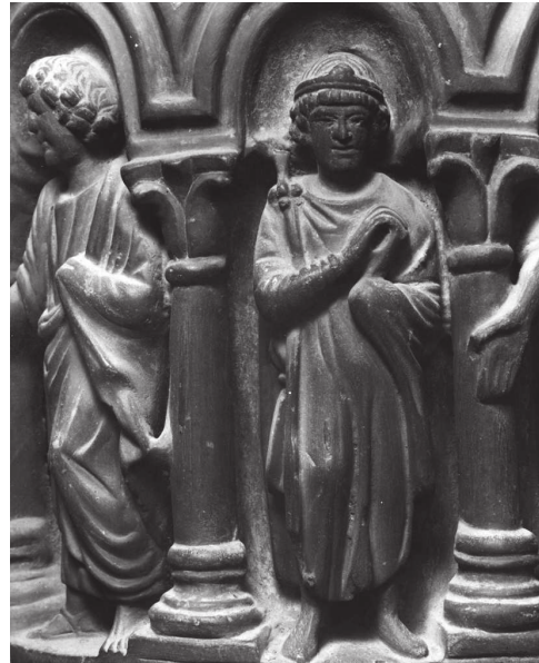
Fig. 7 – Noces de Cana, colonne B du ciborium de l'autel majeur, Venise, Basilique de San Marco, détail de l'époux.