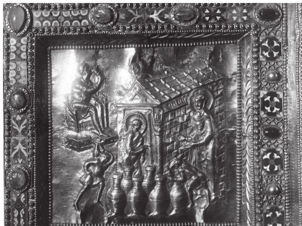
Fig. 19 – Autel de Saint'Ambroise, détail des Noces de Cana, Milan, Saint'Ambroise (cl. : Phototek Kunsthistorisches Institut, Florence, Fln 92194).

Au tournant des IV e et V e siècles, il existe un courant qui attribue à l'architriclin des capacités intellectuelles plus ou moins marquées, qui le distingue des autres serviteurs et qui justifie peut-être sa représentation ultérieure comme un vieil homme, c'est-à-dire comme un personnage doué d'expérience et de connaissances.