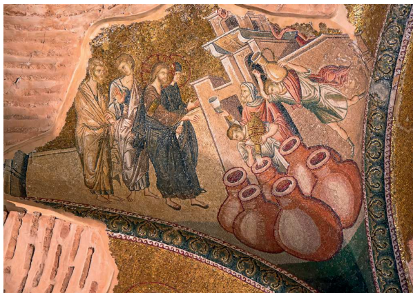
Fig. 15 – Architriclein des mosaïques avec Les Noces de Cana , Istanbul, Saint-Sauveur-in-Chora.