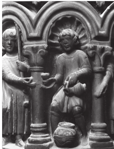
Fig. 11 – Noces de Cana, colonne B du ciborium de l'autel majeur, Venise, Basilique de San Marco, détail d'un serviteur.