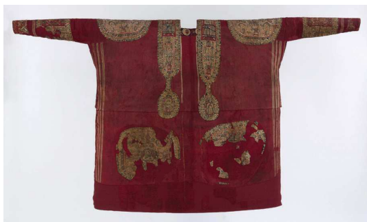
Fig. 12 – Tunique égyptienne.