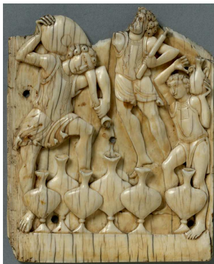
Fig. 13 – Plaquette d'ivoire fragmentaire avec la Transformation de l'eau en vin, Syrie ?.