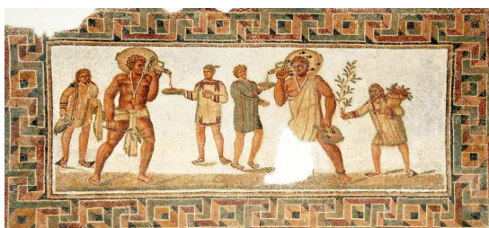
Fig. 14 – Mosaïque avec scène de banquet provenant de la maison dite Dougga, Tunis, Musée national du Bardo