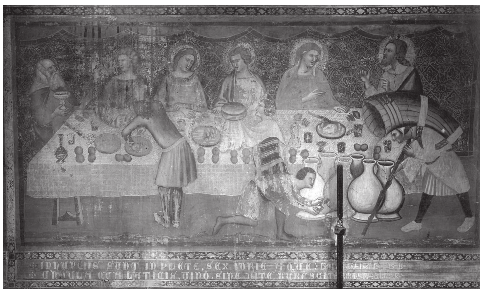
Fig. 17 – Vitale da Bologna?, Noces de Cana , Pomposa, Abbey.