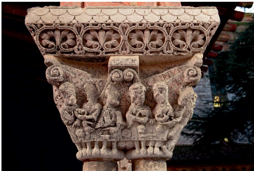
Fig. 18 – Chapiteau n° 35N avec les Noces de Cana, Moissac, cloître (cl. : Photothèque du CESCO, Poitiers).

Saint-Pierre de Salzbourg. Elle figure le personnage couronné, assis à la table à gauche du Christ, un peu à l'écart, tout en tenant le calice à la vue de tous de sa main droite. Toute la scène se déroule à l'intérieur d'un bâtiment, dans lequel sont présents Marie, un apôtre, les deux serviteurs qui remplissent les jarres et un homme qui regarde de profil depuis la gauche (probablement le marié). La présence de la couronne comme attribut de l'architriclin pourrait être justifiée par la présence du préfixe gréco-latin archi- « chef » dans le terme « architriclin ». La place du Christ au centre de la composition, assis à une table rectangulaire, rappelle clairement les représentations de la Cène, un épisode qui, comme nous l'avons vu, est, d'un point de vue sémantique et théologique, étroitement lié aux Noces de Cana.