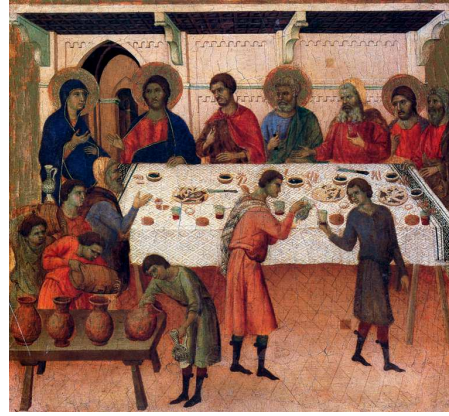
Fig. 16 – Duccio di Buoninsegna, Maestà , détail avec Les Noces de Cana.