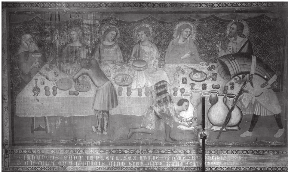
Fig. 17 – Vitale da Bologna?, Noces de Cana , Pomposa, Abbey.