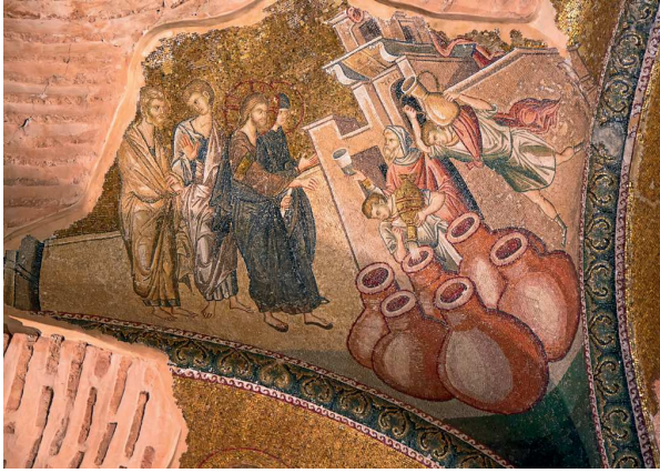
Fig. 15 – Architrclin des mosaïques avec Les Noces de Cana , Istanbul, Saint-Sauveur-in-Chora.