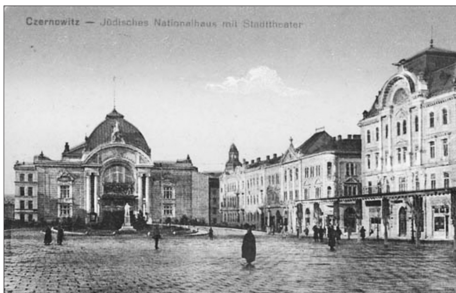
Fig 2. Le Théâtre et Maison nationale juive (à droite).