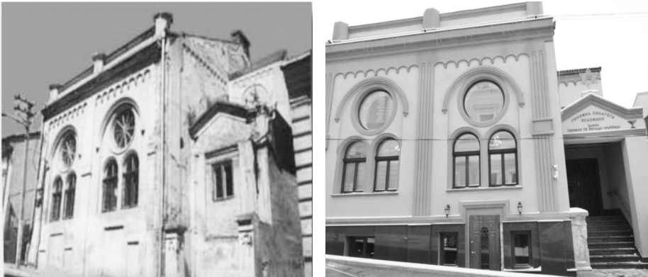
Fig 9-10. La synagogue de la rue Mykola Sadovsky, avant et après rénovation en 2012.

Enfin cinquième et dernier lieu de mémoire : la confrontation passé et présent lors du voyage retour sur les lieux. Là encore, on ne pouvait qu'être frappé du décalage entre la supposée splendeur d'antan et la décrépitude (post) soviétique qui attendait le touriste. Même depuis les rénovations récentes, réalisées à l'occasion du 600 e anniversaire de la fondation de la ville en 2008, on ressent un certain accablement à la vue des lieux « reconstruits » souvent avec une dose de kitsch et de mauvais goût. Entre l'effacement des traces et leur avilissement, on ne sait quel mal est le moindre (Fig. 9-10).