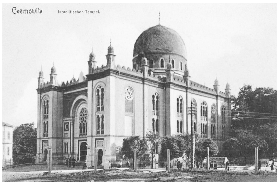
Fig 3. La grande synagogue à l'époque autrichienne.

Et que dire de la synagogue Tempel fréquentée par la bourgeoisie, splendidement conçue par l'architecte polonais Julian Zachariewicz de Lwów en style néo mauresque, à la demande de la communauté juive libérale... et aux pieds de laquelle se tenait un très pittoresque marché aux poissons ( Fischmarkt ) qui a largement fait l'objet de caricatures... (Fig. 3-4 14 ) Quant aux ruines de la synagogue incendiée par les Nazis, elles furent restaurées, sans sa coupole à l'époque soviétique pour y loger le cinéma « Octobre », et abrite toujours un cinéma nommé populairement la « Cinémagogue », en plus d'un club de fitness, ultime témoignage de l'avitissement des lieux.