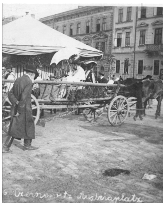
Fig 1. L'Austriaplatz.