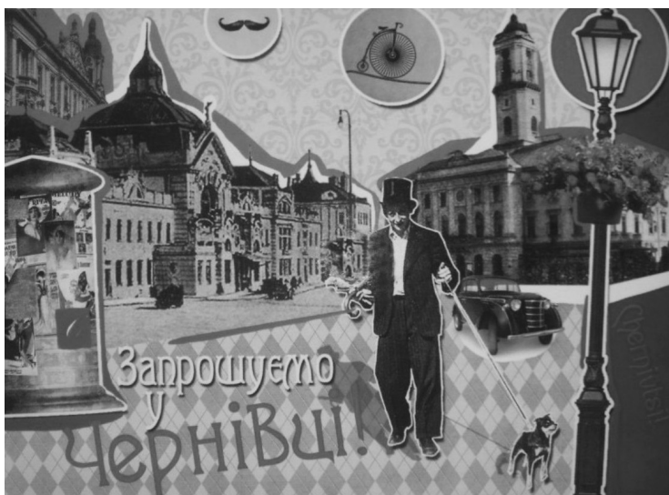
Fig. 5. Carte postale récente de Tshernivtsi sur le thème de la nostalgie.

juif David Fallik par un nationaliste roumain en 1926. Dès 1933, des Allemands ethniques, des partisans du nationaliste roumain Cuza et les nationalistes ukrainiens, formant une collusion fasciste et antisémite, se liguent pour faire un immense pogrome, dévastant 300 magasins et mettant la ville à sac, aux cris de « Vive l'hitlérisme ! » et « À mort les Juifs ! ». Le ton était donné. Le quotidien de langue allemande Czernowitzer deutsche Tagespost approuve. Ensuite viendra le terrible pogrome du 5 juillet 1941, au cours duquel des centaines de Juifs furent fusillés ou torturés à mort par les soldats roumains 17 , prélude à la Shoah et à l'anéantissement de la population juive par les troupes roumaines et nazies.