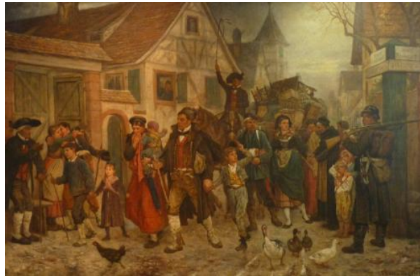
Louis-Frédéric Schutzenberger, L'Exode, 1872, huile sur toile, Musée des Beaux-Arts, Mulhouse.

Depuis le début du XIX e siècle en Europe, les populations changent de nationalité lorsque survient un changement de frontière. Elles disposent néanmoins d'une option leur permettant de conserver leur nationalité à condition, la plupart du temps, de quitter le territoire qui vient de changer de souveraineté. Le cas de l'annexion de l'Alsace-Lorraine par l'Empire allemand, en 1871, offre un exemple d'option particulièrement intéressant.