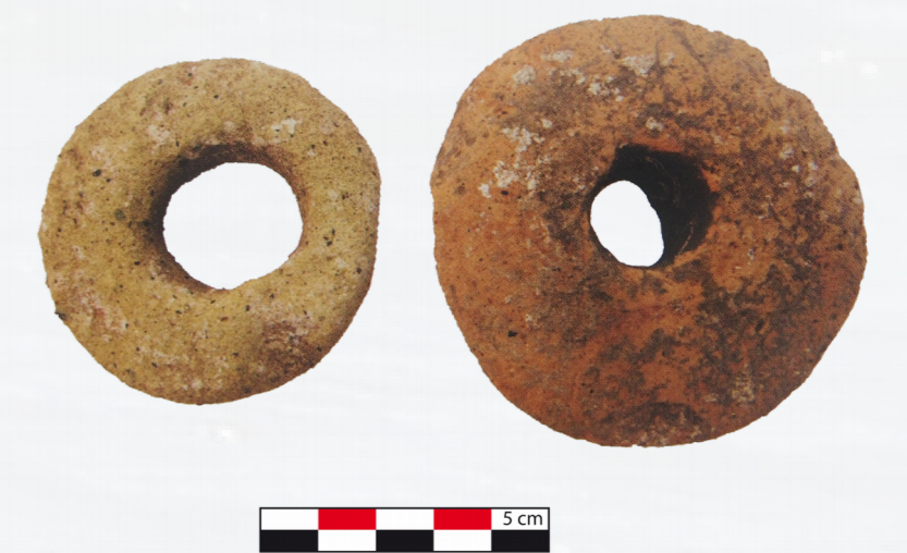
Figure 8 : Lests en terre cuite secteur D1. D'après F. Enei, fig.43, p.63, Quaderno 3 , 2016.

À leur côté ont été retrouvés d'autres lests à filet, se présentant cette fois-ci sous forme d'anneau en terre cuite (fig.8)