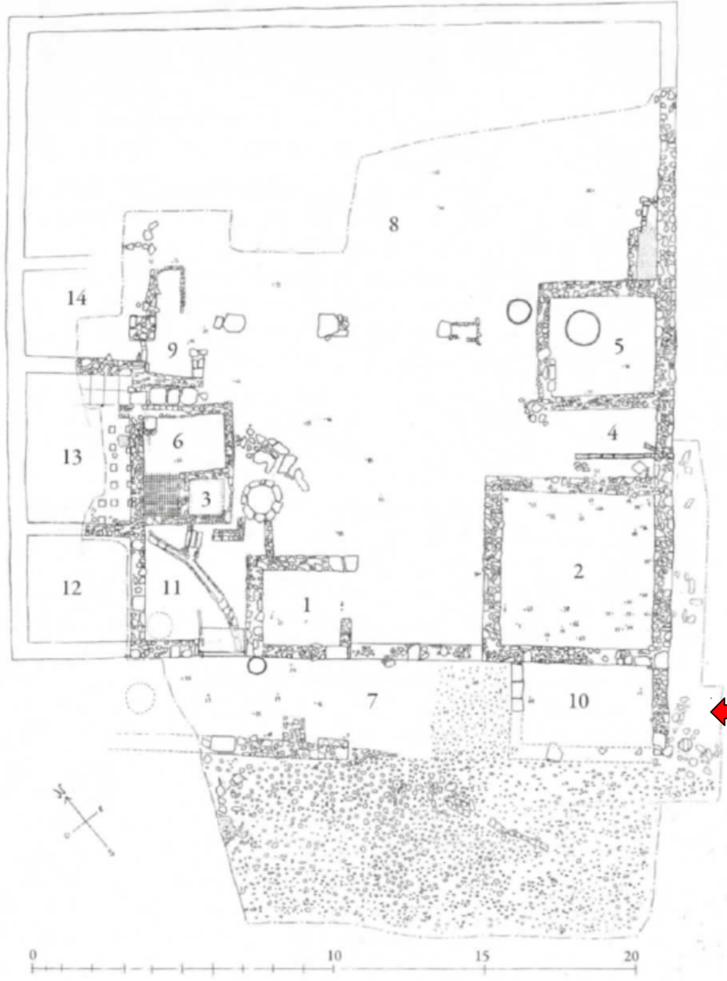
Figure 1 : Plan général de l'édifice carré, à ( Le Guardiole ). D'après F. Enei, fig.1 p.12, Quaderno 3 , 2016.

Situé en regard des viviers et à proximité immédiate de la colonie, le site dit " Le Guardiole" a livré des indices intéressants (fig.1). Composé d'un balneum et d'une domus atria , elle aussi doté d'un petit balnéaire, le complexe évolue entre le I er et le II ème siècle par l'installation dans la domus d'une caupona . C'est à l'intérieur de ce dernier édifice que deux pièces semblent avoir été affectées spécialement à la salaison. De ce même édifice et plus particulièrement de la pièce 10 donnant sur une voie de type glarea strata ou bien une petite place, proviennent un hameçon ainsi qu'une navette en bronze (fig. 2 et 3). Cette dernière se présente sous la forme d'une tige filiforme se terminant à ses deux extrémités par deux appendices recourbés l'un vers l'autre. Sa morphologie permet d'interpréter cet objet comme étant un outil servant à ramender les filets de pêche. Enfin, parmi le mobilier découvert dans la pièce n°10, on peut citer un poids de balance et de nombreux coquillages bivalves dont 17 fragments d'huîtres ( Ostreidae ) tous issus de l'US 30. L'attestation d'huîtres dans la taverne est probablement à mettre en relation avec la présence, parmi les pièces qui composent les viviers, d'une ostriaria , utilisée surtout pendant le II ème siècle. Ces indices confirment la forte relation entre les habitants du site et la mer toute proche.