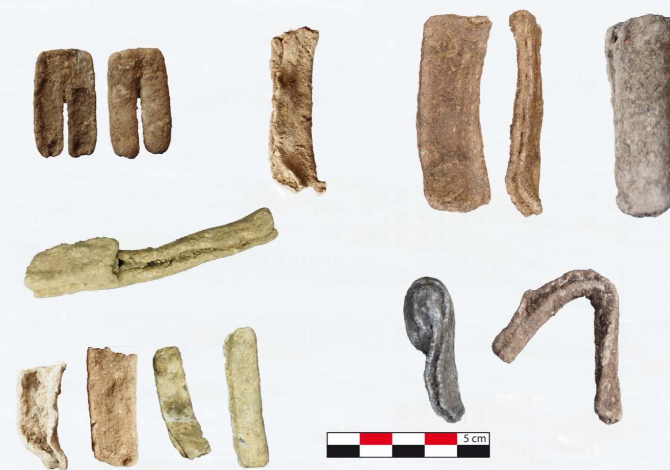
Figure 7 : Lests en plomb, secteur D5.

Il s'agit principalement de plusieurs fragments de plomb provenant des niveaux d'époque impériale des secteurs D3 (US 4 et 5) et D5. Ces fragments sont identifiables comme des lests de filet de pêche. Il s'agit de plaquettes de plomb repliées dans le sens de la longueur composant de petit tube de section circulaire ou carrée pliés en deux par pincement sur le filet (fig.7). Leurs faibles dimensions suggèrent un usage sur des cordages de petit diamètre, accroché à un petit filet, ou bien mis en série sur un filet de plus grande taille.