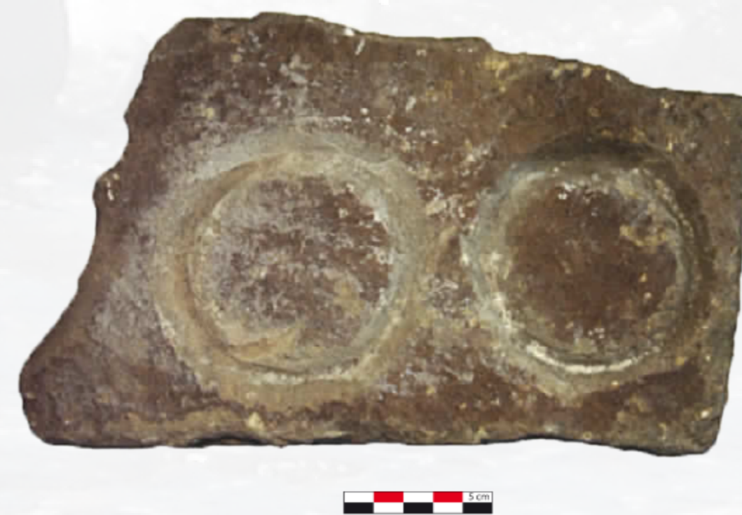
Figure 9 : Moule en pierre (secteur D1, pièce 5). D'après F. Enei, fig. 14, p. 52 et fig.41, p.61, Quaderno 3 , 2016.

Ces mêmes fragments ont été découverts l'année dernière dans les pièces adossées à l'enceinte du castrum (secteur D1) d'où provient en outre un autre hameçon en bronze, deux lests en terre cuite en forme d'anneau ainsi que un moule en pierre pour la fabrication d'anneaux probablement en plomb (pièce n° 5). Deux anneaux en plomb de diamètre comparable à celui du moule ont été par ailleurs découverts sur le fond de la mer à proximité des rivages. Ces éléments tout comme l'hameçon ainsi que les fragments d'huîtres découverts dans les niveaux de remblais d'époque impériale du secteur D3 soulignent l'importance des produits de la mer dans l'alimentation et les pratiques artisanales et économiques des habitants de la colonie.