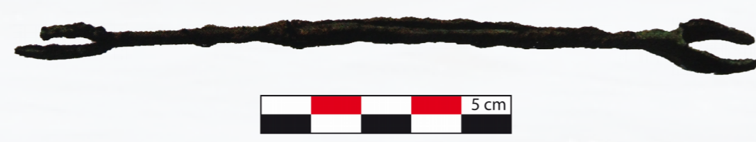
Figure 2 : Navette à filet en bronze, pièce 10 (Le Guardiole). D'après F. Enei, fig.5, p. 16., Quaderno 2 , 2013.