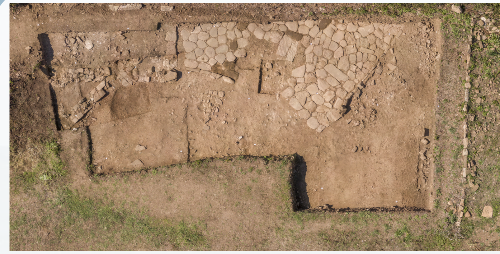
Figure 6 : Cliché du secteur français D3. D'après V. Cicolani et G. Poccardi, fig. 13, CEFR , 2017.

Il s'agit principalement de plusieurs fragments de plomb provenant des niveaux d'époque impériale des secteurs D3 (US 4 et 5) et D5. Ces fragments sont identifiables comme des lests de filet de pêche. Il s'agit de plaquettes de plomb repliées dans le sens de la longueur composant de petit tube de section circulaire ou carrée pliés en deux par pincement sur le filet (fig.7). Leurs faibles dimensions suggèrent un usage sur des cordages de petit diamètre, accroché à un petit filet, ou bien mis en série sur un filet de plus grande taille.