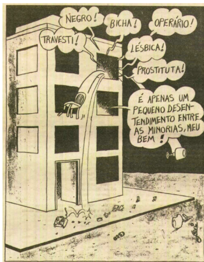
Figura 2: Levi (1980), Lampião da Esquina , n°22, March, p.11

democráticas para todas as minorias. Na charge, os diferentes setores oprimidos da sociedade estavam fisicamente ausentes, mas representados visualmente graças à presença de insultos proferidos dentro de um edifício, representação metafórica da sociedade brasileira. Levi criticava o discurso anônimo, minimizando ironicamente a situação, que reduzia de propósito as lutas e exigências fundamentais a um mero “desentendimento entre as minorias”. Esta concepção global e convergente da luta política tem provocado muitas críticas internas a Lampião , assim como ao feminista Brasil Mulher , exigindo maior comprometimento com causas específicas.