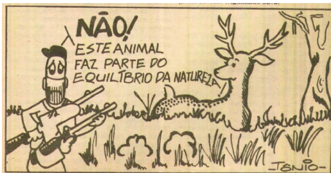
Figura 1: Tônio (1978), Lampião da Esquina , n°3, 25 May, p.5

Seguindo a lógica da inversão de estereótipos já evidente na escolha do título, a redação iniciou uma reapropriação de xingamentos e termos pejorativos usados para humilhar ou ridicularizar as pessoas homossexuais, tais como “veado”, “bicha” ou “sapatão”. Aguinaldo Silva, um dos fundadores do Lampião , analisou no terceiro número esse processo de transformação de insultos em reivindicações (Silva, 1978, p. 5). Uma charge assinada Tônio criticava a homofobia usando a metáfora da caça baseada no duplo sentido da palavra “veado” (Figura 1). O traço simples, quase infantil, como em um desenho animado, representava dois caçadores armados: um pronto para atirar em um animal adulto de grande porte e o outro gritando “Não! Este animal faz parte do equilíbrio da natureza!”. A charge reforçava assim o ponto de vista desenvolvido por Silva no artigo mencionado, ao insistir no pertencimento do veado – então, metaforicamente, dos homossexuais – à natureza, ao meio-ambiente assim como à sociedade brasileira como um todo.