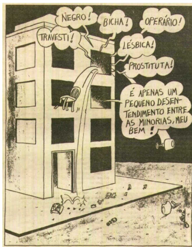
Figura 2: Levi (1980), Lampião da Esquina , n°22, March, p.11

democráticas para todas as minorias. Na charge, os diferentes setores oprimidos da sociedade estavam fisicamente ausentes, mas representados visualmente graças à presença de insultos proferidos dentro de um edifício, representação metafórica da sociedade brasileira. Levi criticava o discurso anônimo, minimizando ironicamente a situação, que reduzia de propósito as lutas e exigências fundamentais a um mero “desentendimento entre as minorias”. Esta concepção global e convergente da luta política tem provocado muitas críticas internas a Lampião , assim como ao feminista Brasil Mulher , exigindo maior comprometimento com causas específicas.