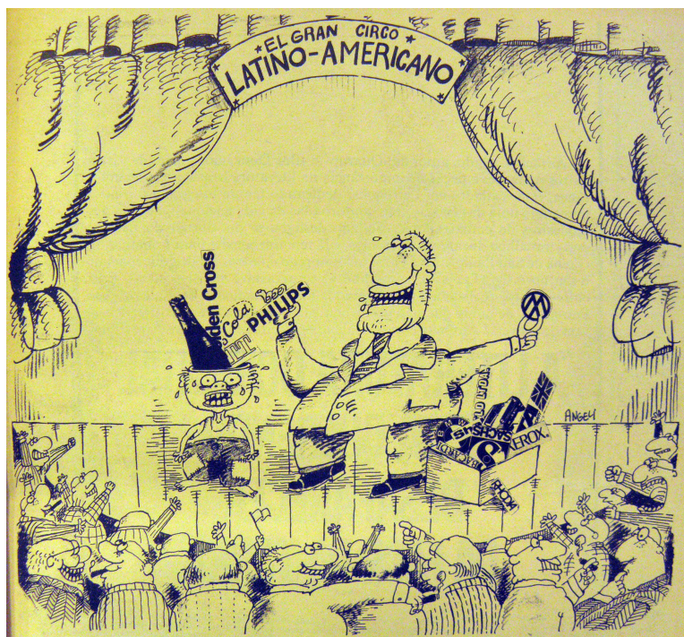
Figura 4: Angeli (1976), Versus , n°3, p.29

No palco de um circo, um empresário disfarçado estava martirizando uma segunda figura vestida de trapos, enchendo sua cabeça com os nomes e logotipos de grandes empresas internacionais. O público de homens brancos carecas parece incentivar a violência e a decadência dos atos. O título do desenho cumpriu o papel de criar uma metáfora da América Latina inteira, vítima passiva de uma lavagem cerebral e de ataques estrangeiros. A linha simples, redonda e animada do cartunista elaborou uma transposição do cenário internacional para uma grande feira onde os povos, territórios e mercados latino-americanos foram concedidos a quem fez a maior oferta.