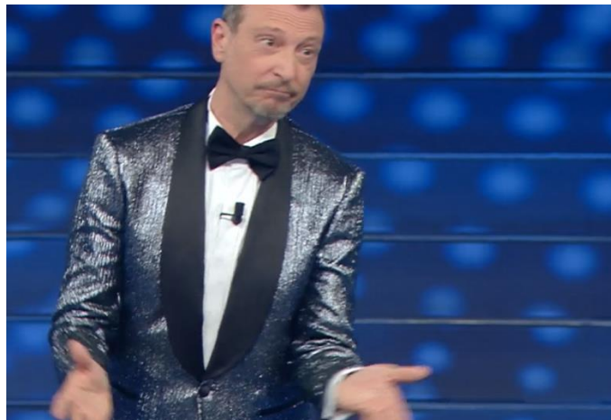
Fig. 2 : Capture d'écran de la gestualité de victimisation d'Amadeus – sourcils remontées, yeux grands ouverts, lèvres serrées, paumes vers le haut – tandis qu'il introduit Leotta

Ce dispositif actantiel est d'abord mis en discours à l'entrée en scène de la première animatrice, la présentatrice sportive Sky Diletta Leotta (nous sommes à environ une heure du début de l'émission) : « C'est le moment de la voir descendre sur le terrain. (...) Elle est belle. Puis-je le dire ? Je l'ai dit. Elle est sympathique. Puis-je le dire ? Je l'ai dit. Elle a une licence en droit. Je ne le savais pas, c'est elle qui me l'a dit. Au festival de Sanremo 2020... Diletta Leotta ! » (trad. nôtre). On voit qu'Amadeus s'adresse aux spectateurs-complices pour délégitimer le système de valeur de ceux qui l'auraient obligé à demander la permission pour vénérer les figures féminines (« Puis-je le dire ? ») ; l'itération de la formule signale, au contraire, que c'est lui qui aurait été victime d'une agression gratuite 10 . Pour compléter la stratégie de victimisation, il affiche une gestualité particulière (fig. 2) qui sert de « signal d'alarme au destinataire complice – ici, le public – pour interpréter le message autrement que dans son sens apparent » ( Id. : 168, trad. nôtre).