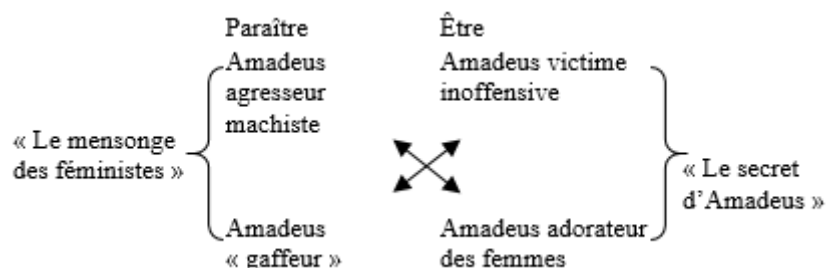
Fig. 4 : L'ironie de Sanremo

L'ironie d'Amadeus, en revanche, ne revient pas sur la nature sexiste de ses actes, mais cherche à renverser le rapport de pouvoir que la dénonciation met en évidence. Cette opération aboutit à une redistribution des rôles de « victime » et d'« agresseur » internes à la catégorie « domination ». Cela permet de réorienter la charge de la violence. Nous pouvons visualiser cette opération sur le carré sémiotique en figure 4, qui met en corrélation les valeurs internes à la catégorie de la domination et celle propre à la catégorie de la véridiction.